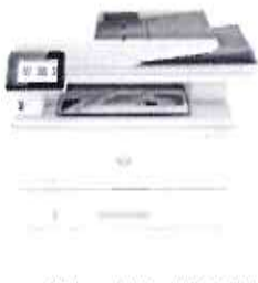
Impressora HP LaserJet Pro MFP 4103dw

Esta impressora foi desenvolvida para proporcionar o máximo de produtividade com velocidades rápidas e hardware confiável, oferecendo uma utilização diária sem complicações onde quer que o trabalho aconteça, para que você possa se concentrar mais no seu negócio.