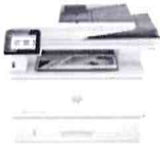
Impressora HP LaserJet Pro MFP 4103fdw