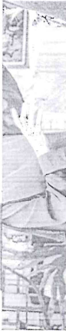
MADRE Bernadette falou sobre a chegada das reliquias de Santa Teresinha

WILNAN CUSTÓDIO ESPECIAL PARA O POVO wilnan.oliveira@opovo.br