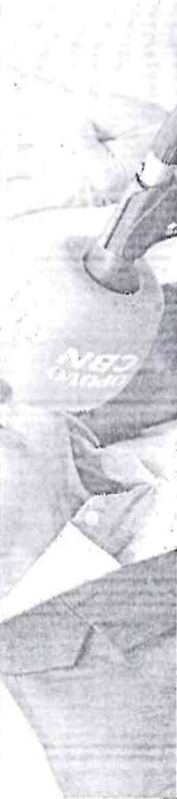
PREFEITO José Sarto foi entrevistado na rádio O POVO CBN

da Silva (PT), em 2018, por corrupção passiva e lavagem de dinheiro no caso de um aparcamento de três andares no Guarujá, litoral de São Paulo.