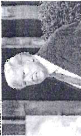
TRUMP chegou ontem a Nova York para se apresentar à Justiça