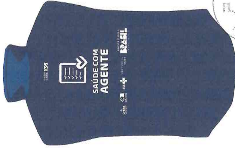
parte de trás