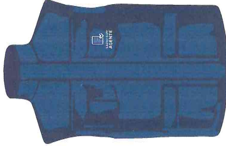
parte da frente