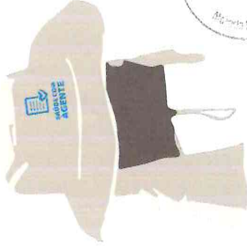
parte da frente do chapéu