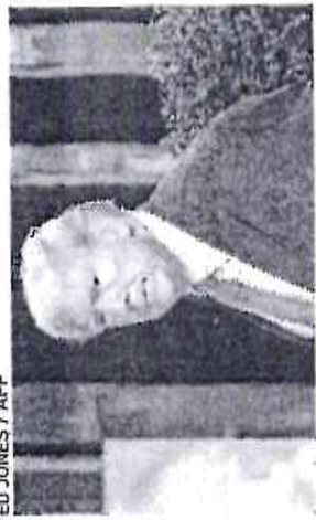
TRUMP chegou ontem a Nova York para se apresentar à Justiça