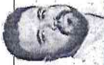
ESTÁ COLUNA É PUBLICAÇÃO DE TERÇA-FEIRA SÓCULO