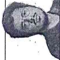
ESTA COLUNA É PUBLICADA ÀS SEGUNDAS, QUINTAS E SEXTAS