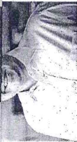
EX-PREFEITO Roberto Cláudio defende que seu partido, o PDT, faça oposição ao governo Elmano