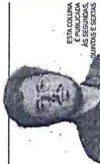
ESTA COLUNA É PUBLICADA ÀS SEGUNDAS, QUINTAS E SEXTAS