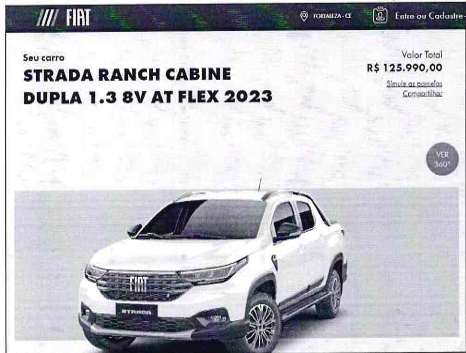
Figura 4: modelo

Diante disso, restam-se indicativos que a licitante, ora vencedora, não cumpriu/obedeceu as exigências editalícias, conforme cláusulas 5.1, 5.1.3 e 5.2.