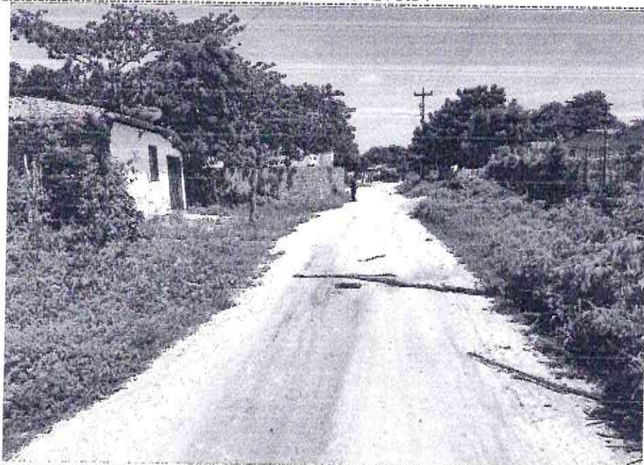
Final (Estaca E31+6,91m) da Rua Antônio Pereira da Silva (Localidade: Patos) UTM 567089.13/9479964.28