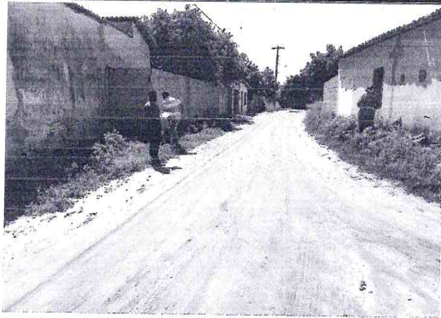
Início (Estaca E00) da Rua Antônio Pereira da Silva (Localidade: Patos) UTM 566565.61/9480275.37