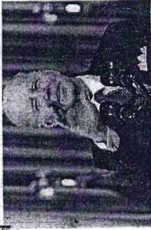
BIDEN tem elevado o tom dos ataques a Putin