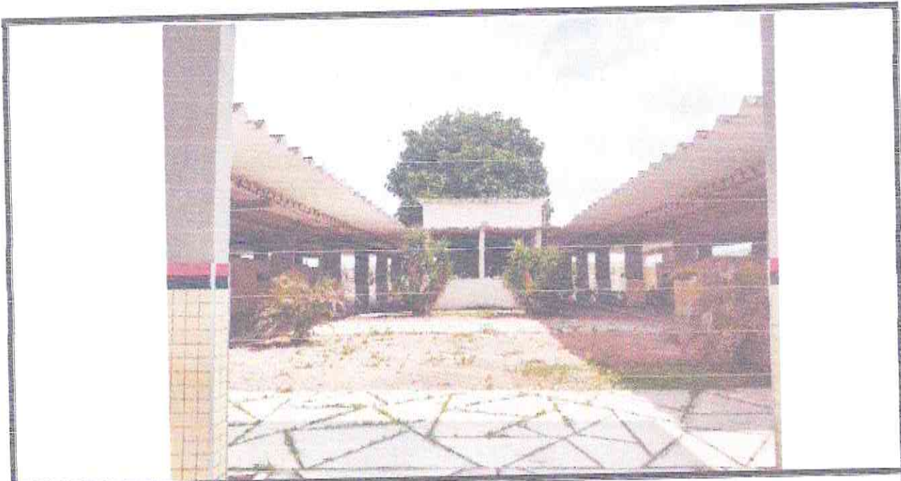
Figura 13- UTM: 570262.75/9434759.66