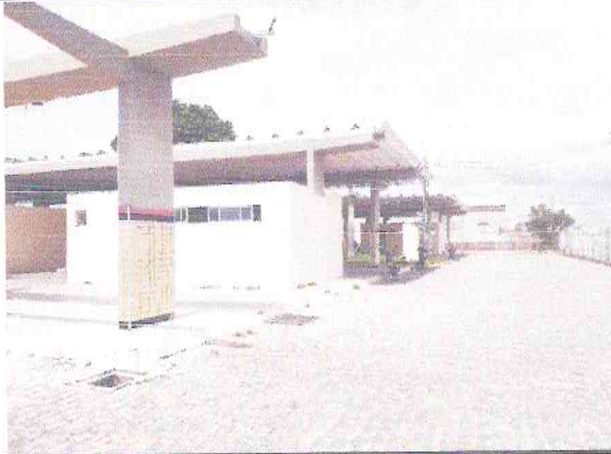
Figura 03- UTM: 570321.74/9434776.58