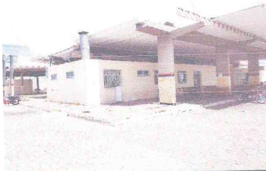
Figura 11- UTM: 570283.84/9434738.89