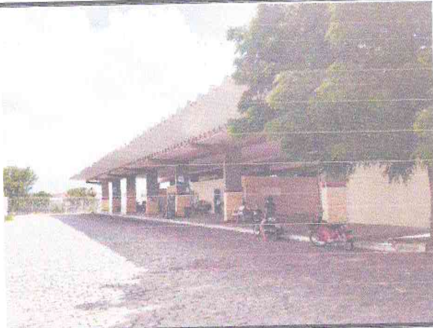
Figura 07 - UTM: 570234.69/9434777.20