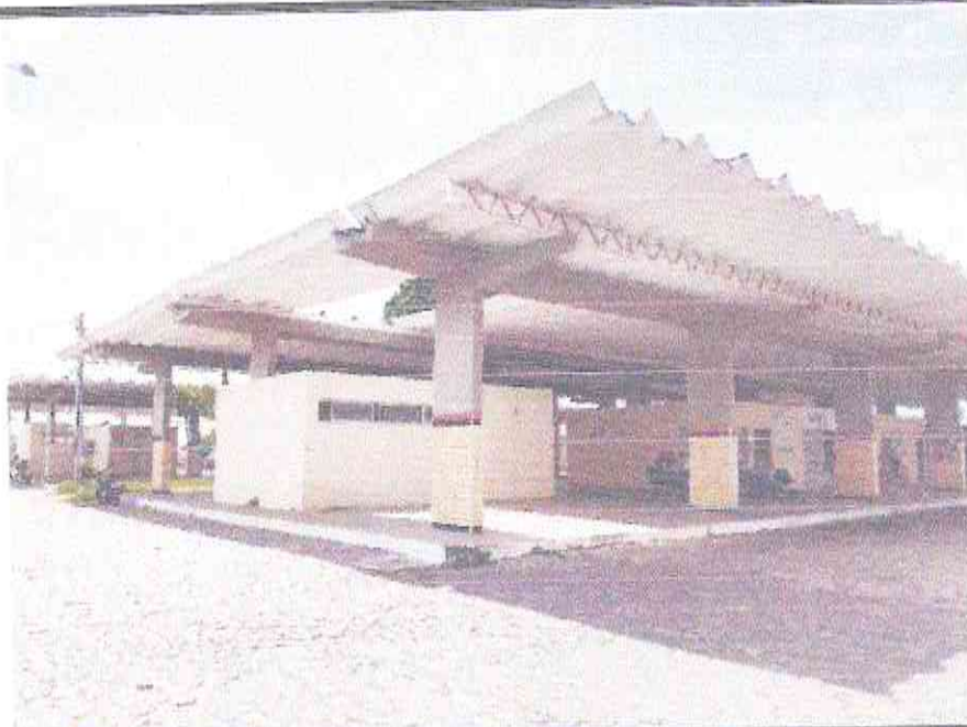
Figura 05- UTM: 570274.60/9434819.63