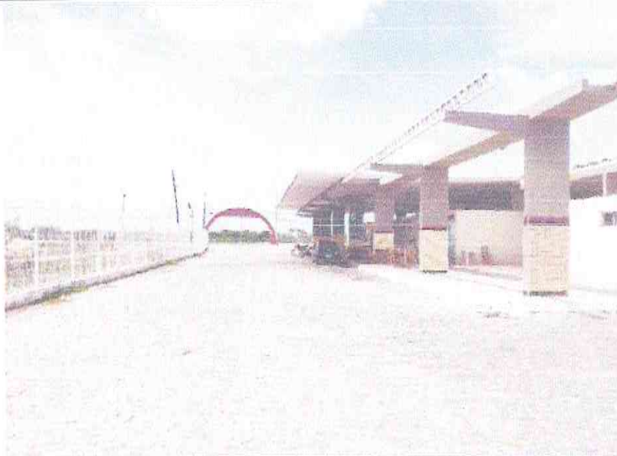
Figura 01- UTM: 570321.74/9434776.58