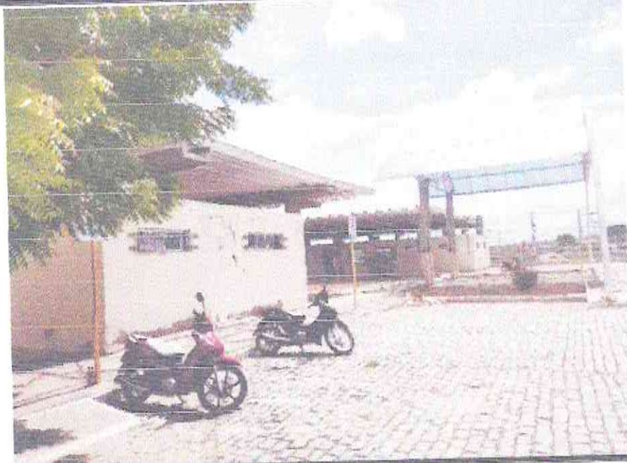
Figura 09- UTM: 570234.69/9434777.20