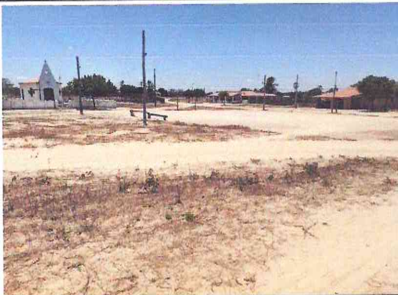
Figura 05- UTM: 582585.45/9439723.65