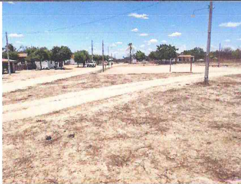
Figura 12- UTM: 582525.63/9439675.41