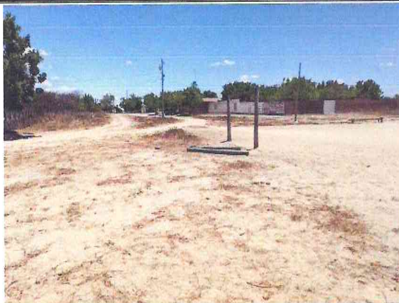
Figura 03- UTM: 582552.78/9439735.58