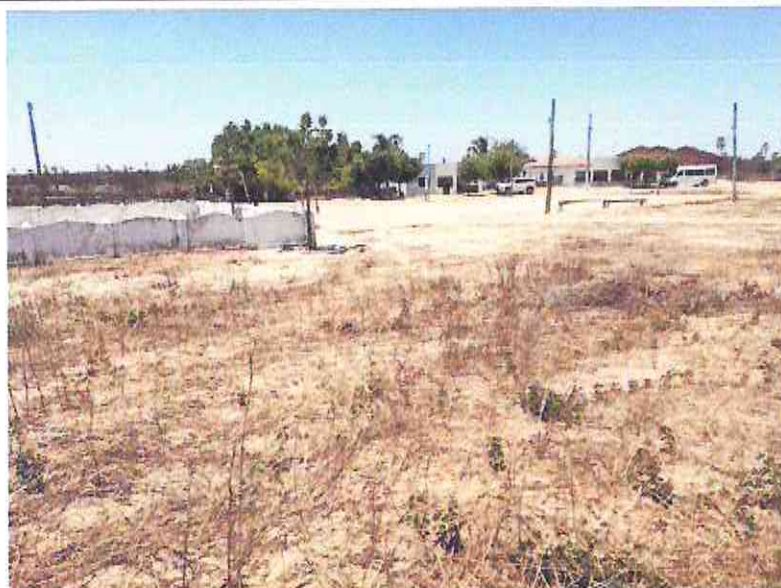
Figura 08- UTM: 582580.40/9439666.75