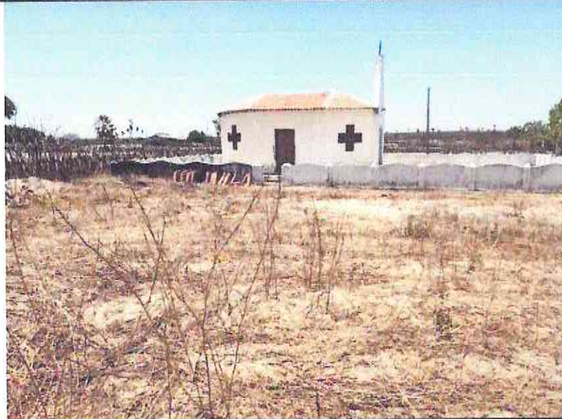
Figura 09- UTM: 582580.40/9439666.75