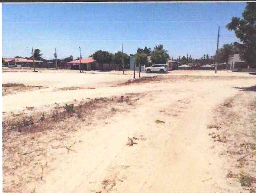
Figura 04- UTM: 582585.45/9439723.65