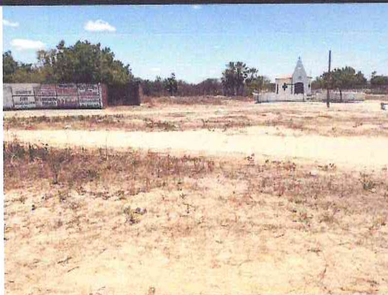
Figura 06- UTM: 582585.45/9439723.65