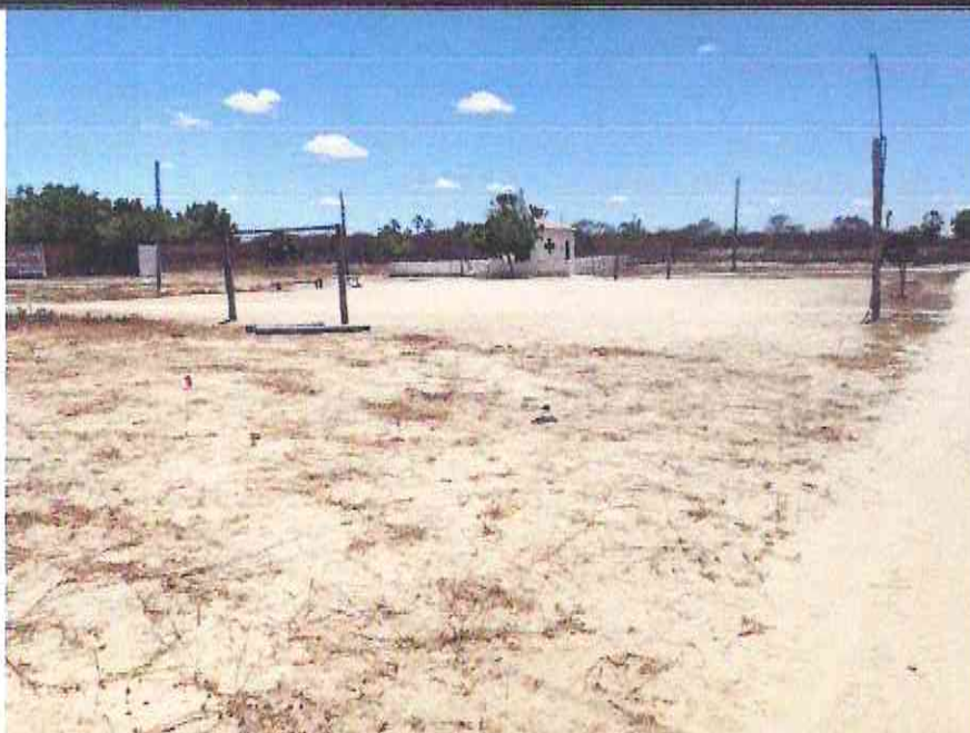
Figura 02- UTM: 582552.78/9439735.58