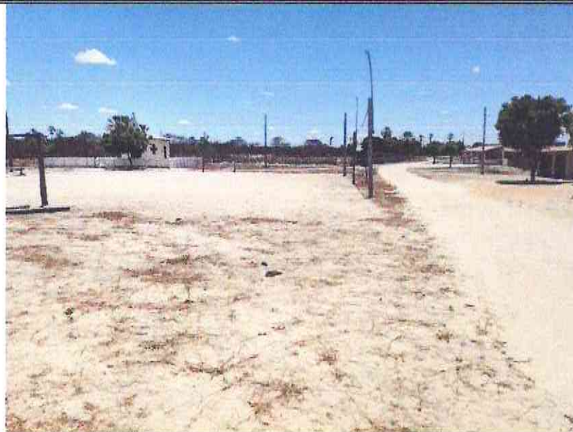
Figura 01- UTM: 582552.78/9439735.58