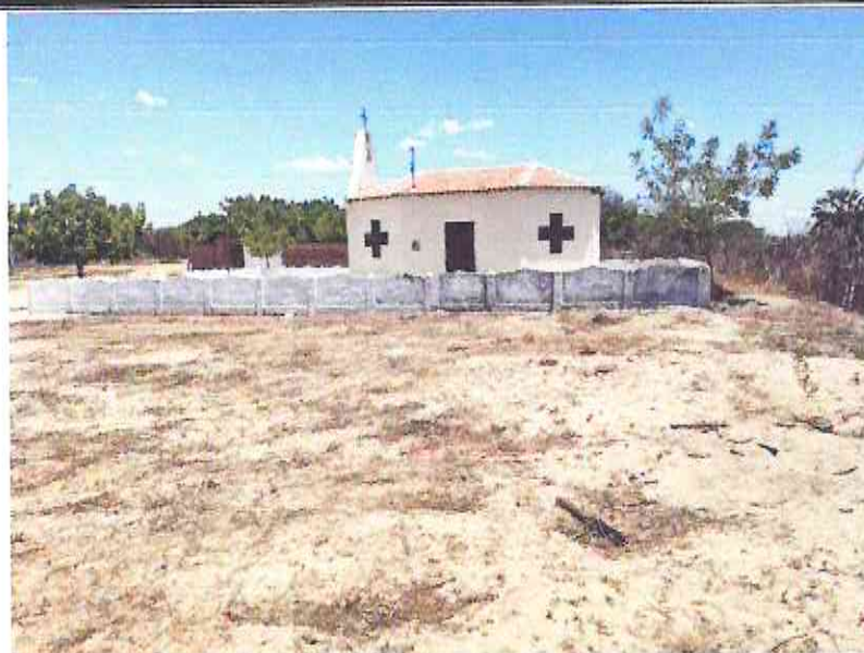
Figura 10- UTM: 582525.63/9439675.41