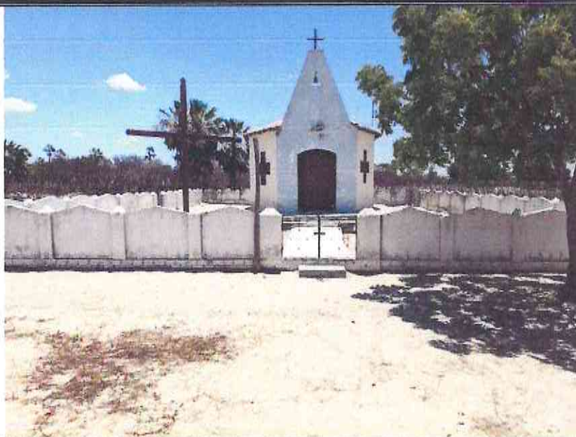
Figura 13- UTM: 582562.41/9439694.82