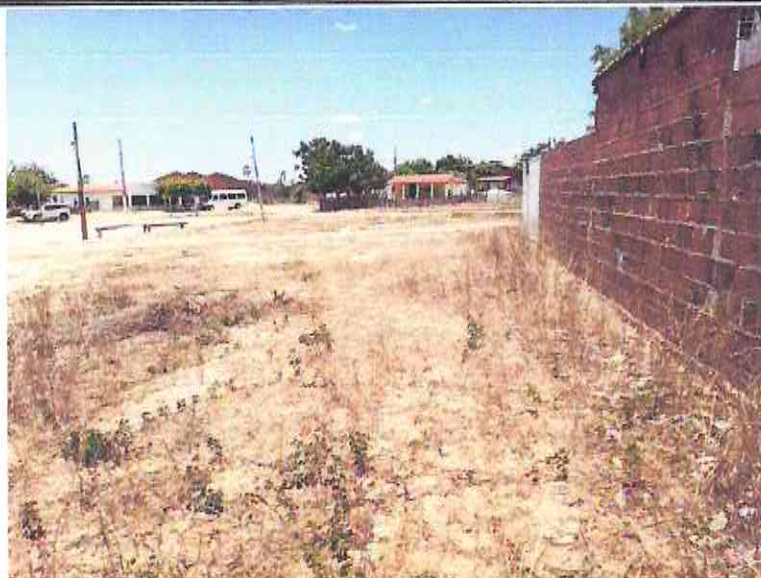
Figura 07- UTM: 582580.40/9439666.75