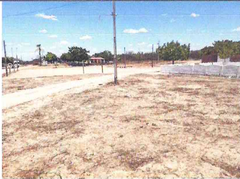
Figura 11- UTM: 582525.63/9439675.41