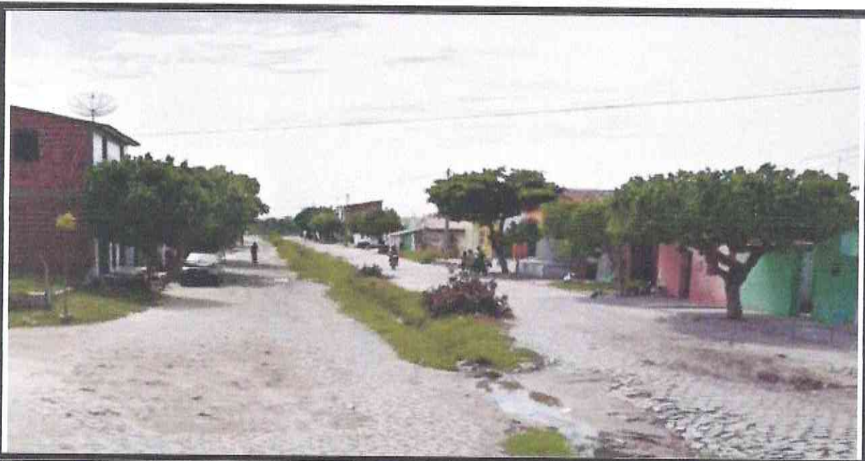
Figura 05- Início do Canteiro 3- UTM: 569562.69/9434712.64