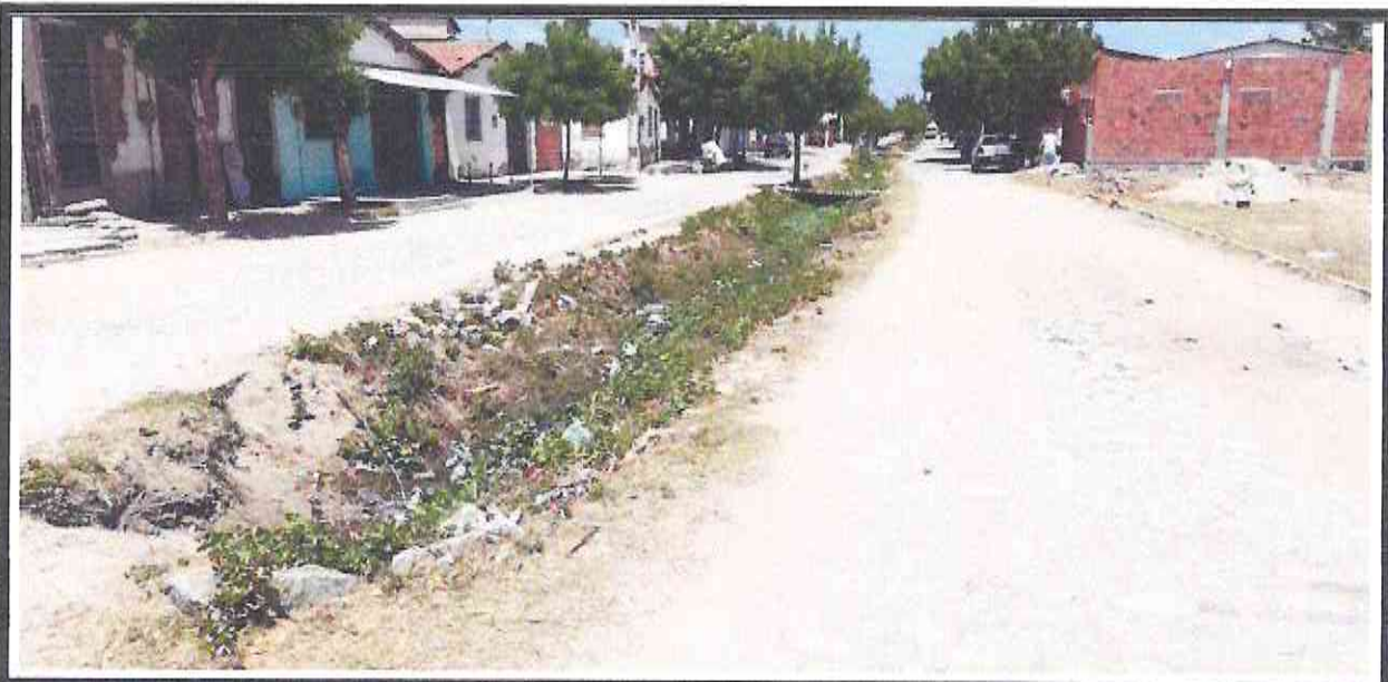
Figura 07- Início do Canteiro 4- UTM: 569741.28/9434674.10