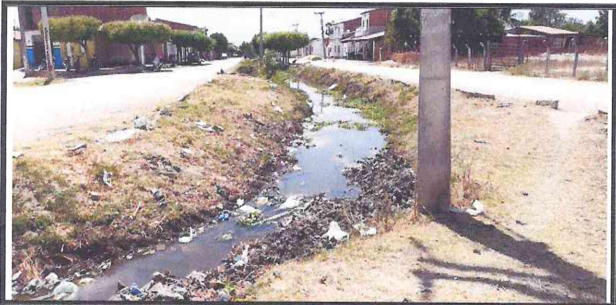
Figura 01- Início do Canteiro 1- UTM: 569303.59/9434769.00