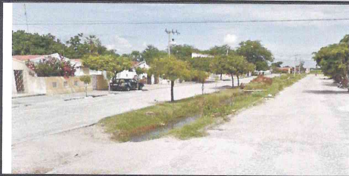
Figura 02- Final do Canteiro 1- UTM: 569454.67/9434735.78