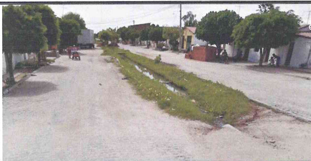
Figura 03- Início do Canteiro 2- UTM: 569450.63/9434735.87