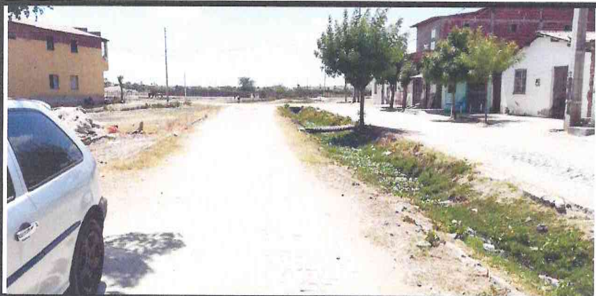
Figura 08- Final do Canteiro 4- UTM: 569663.09/9434691.03