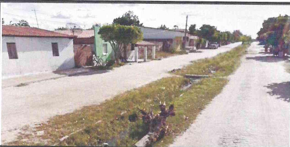
Figura 06- Final do Canteiro 3- UTM: 569653.75/9434693.02