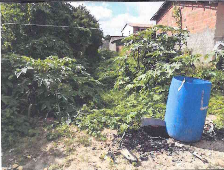
Figura 03 – Frente - oeste canal de alvenaria do distrito de Aruaru no município de Morada Nova/CE

9 Osmanir G. de Mendonça Jr. Eng. Civil / CREA-CE/49409-0 RN:061095914-0