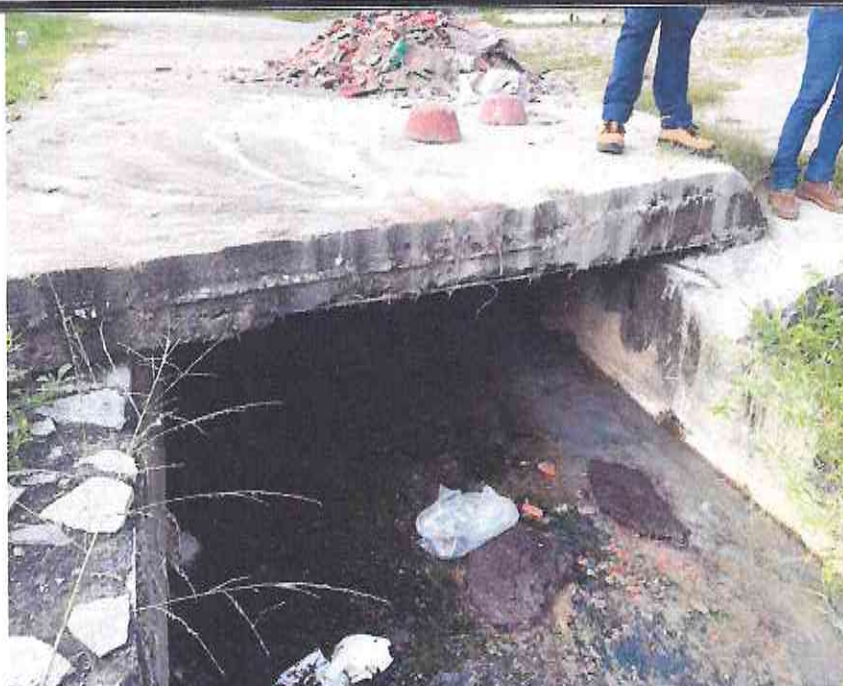
Figura 02- Detalhe- leste do canal de alvenaria no Distrito de Aruaru em Morada Nova- CE

Osmanir C. de Mendonça Engº Civil / CREA-CE:49409 RN:051035914-0