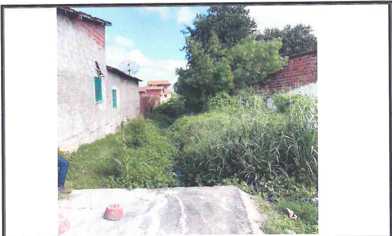
Figura 01- frente-leste do canal de alvenaria no distrito de Aruaru de Morada Nova-CE

4 Osmanir de Mendonça Jr. Eng. Civil CREA/CE 49409 BR061000914-0