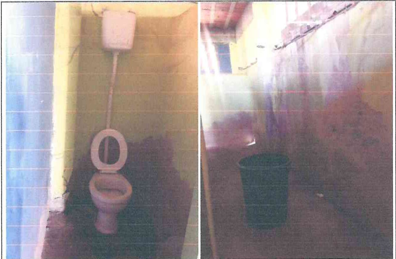
Figura 04- Aparelho sanitário e chuveiros existentes em banheiros no Estádio Pedro Eymard no município de Morada Nova/CE

A Figura 04, exibe uma área que passará por readequação estrutural e substituição das loças existentes.