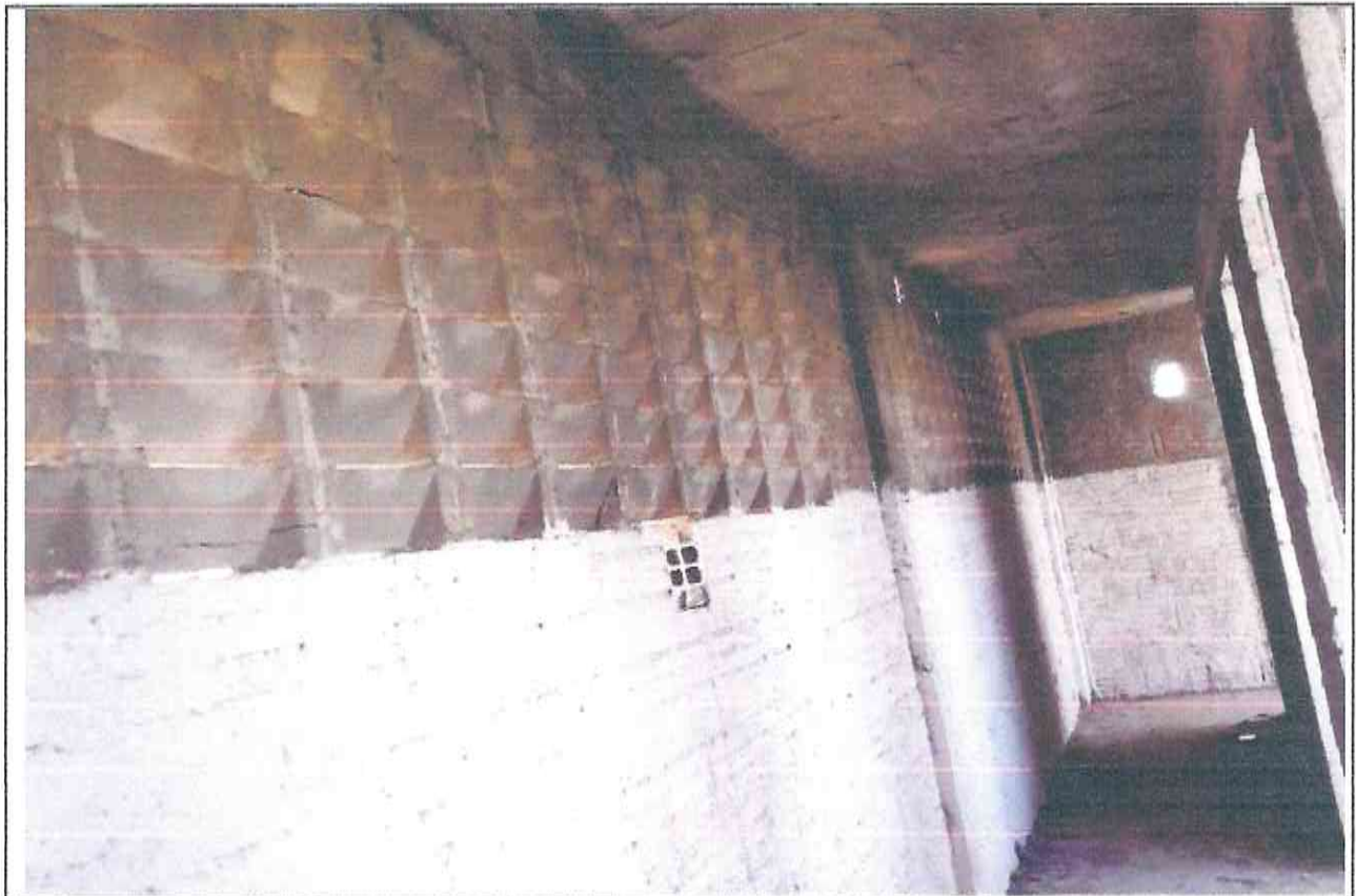
Figura 06- Corredor de acesso as cabines do Estádio Pedro Eymard no município de Morada Nova/CE

A Figura 6 exibe o corredor que possibilita o acesso as cabines do estádio, sendo fundamental o chapisco, reboco, emassamento e a pintura deste.