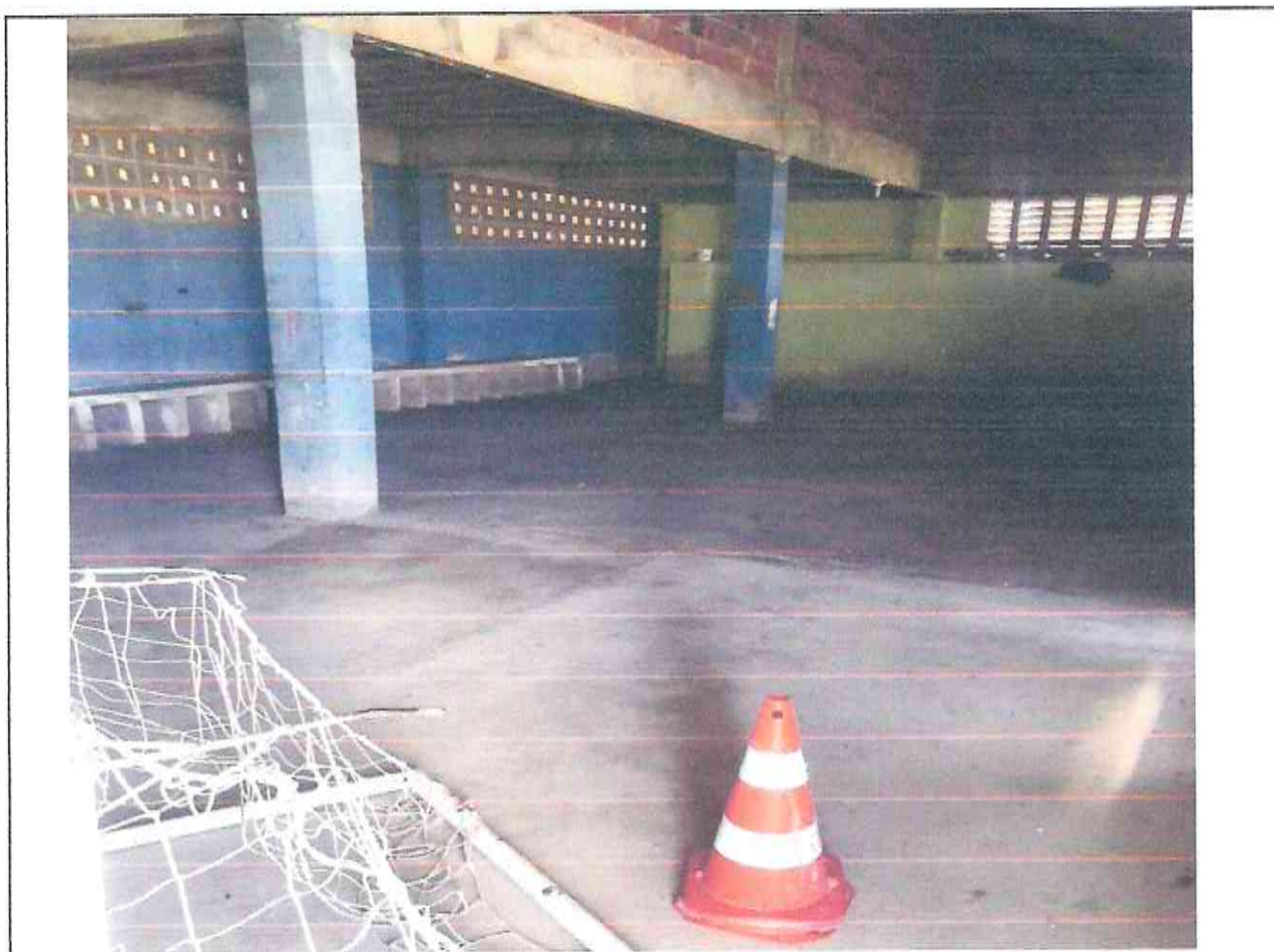
Figura 02- Área reservada para banheiros no Estádio Pedro Eymard no município de Morada Nova/CE

A Figura 02 exibe a sala destinada para instalação de banheiro e vestiário, sendo nesta necessária a instalação de pontos hidráulicos, aparelhos sanitários, dentre outros materiais que possibilitem funcionamento do local.