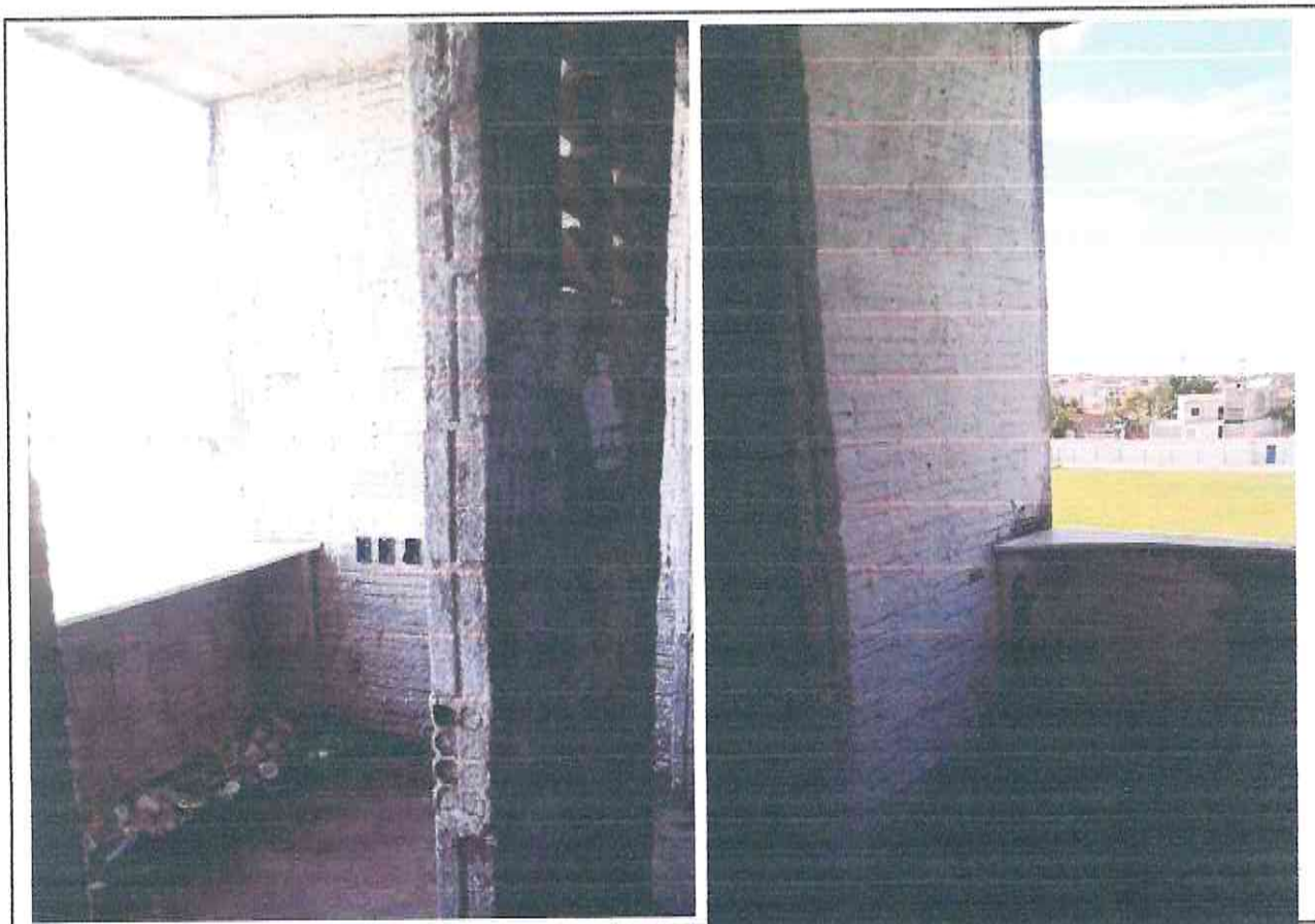
Figura 05- Cabines do Estádio Pedro Eymard no município de Morada Nova/CE

A Figura 05 exhibe as Cabines centrais do Estádio Municipal de Morada Nova-CE, sendo perceptível a necessidade de emassamento e pintura nas paredes e substituição de elementos como o mármore da bancada presente na Figura.