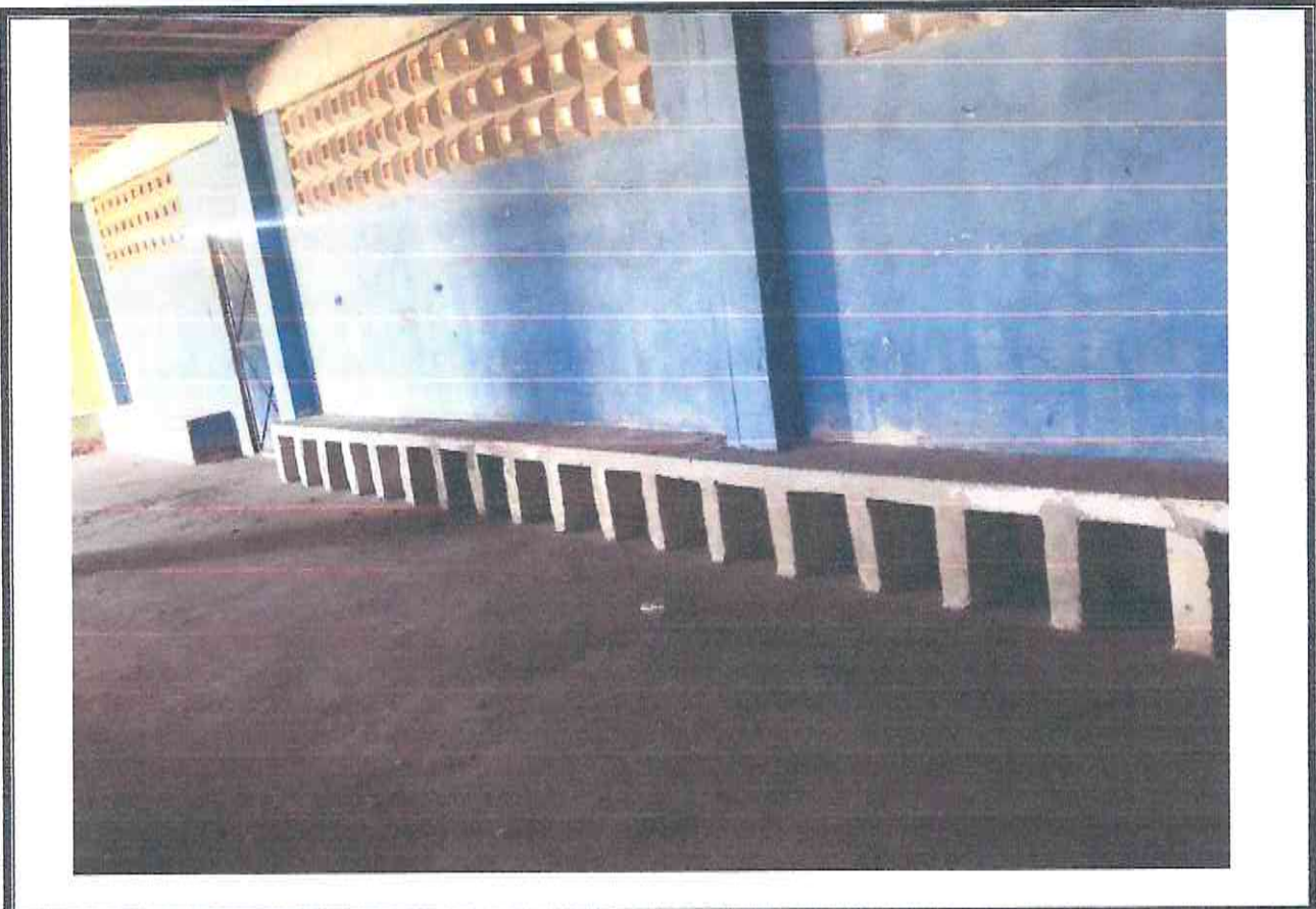
Figura 01- Área reservada para banheiros no Estádio Pedro Eymard no município de Morada Nova/CE

A Figura 01 exhibe o espaço destinado aos novos banheiros e vestiários do Estádio Pedro Eymard, sendo visível a necessidade de pintura látex nas paredes e revestimentos cerâmicos no piso. Além disso, serão necessárias novas paredes de alvenaria como divisórias para área de banho.