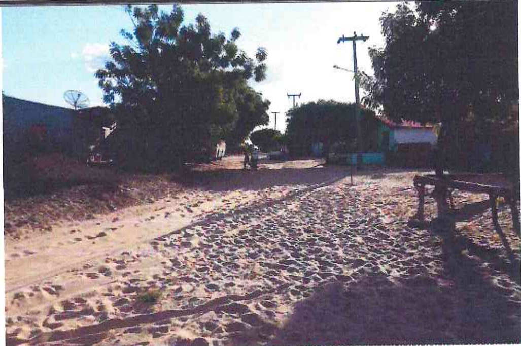
Início (Estaca E00) da Rua Sem Denominação (Localidade: Lagoa das Carnaúbas) UTM 0546467.94 / 9438772.02