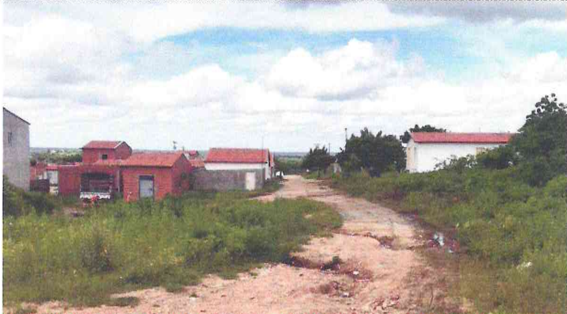
Final (Estaca E14 + 10,77m) da Rua Gumercindo José Da Silva (Bairro: Henrique Hermógenes Girão) UTM 567939.62/9436124.41