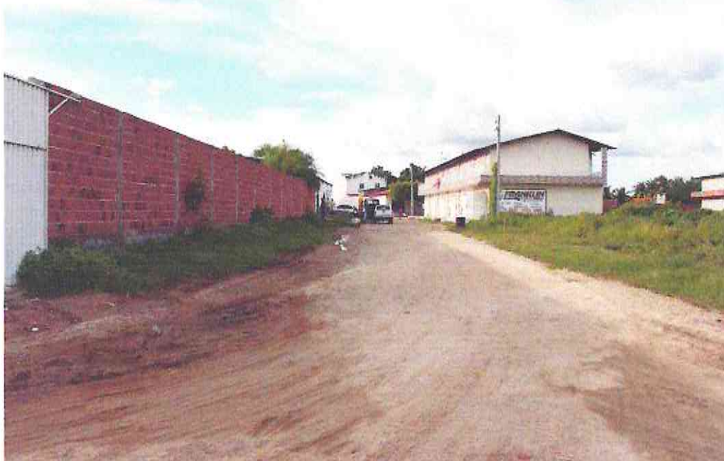
Final (Estaca E06 + 7,15m) da Rua Antônio Bezerra (Bairro: 2 de Agosto) UTM 570238.80/9435510.46