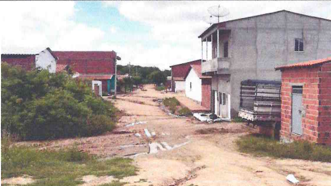
Início (Estaca E00) da Rua Santa Luzia (Bairro: Henrique Hermógenes Girão) UTM 567931.18/9436055.53