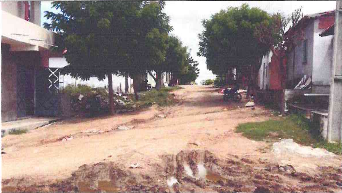
Início (Estaca E00) da Rua Henrique Girão (Bairro: Henrique Hermógenes Girão) UTM 567736.99/9435461.48