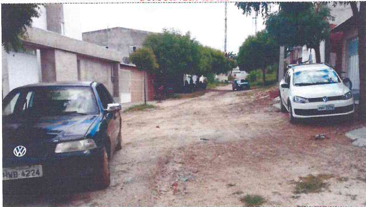
Final (Estaca E10 + 8,65m) da Rua Zacarias Fernandes (Bairro: Centro) UTM 569934/9435419