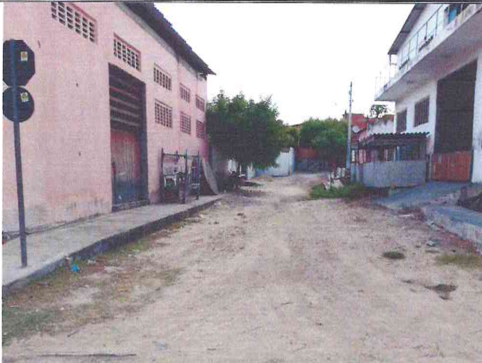
Início (Estaca E00) da Rua Sem Denominação (Bairro: São Francisco) UTM 569733.00 /9436055.46