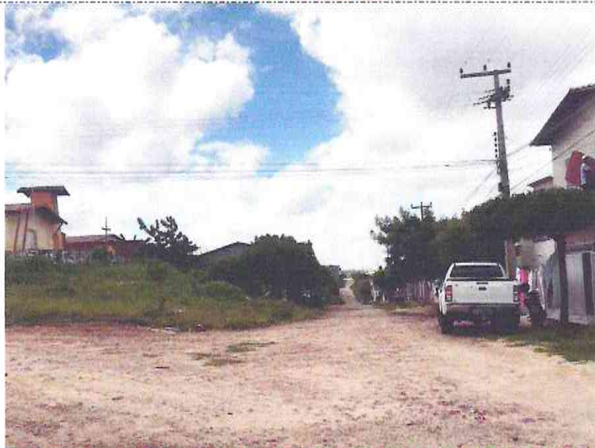
Final (Estaca E21 + 18,27m) da Rua Cel. José Paulo Girão (Bairro: Henrique Hermógenes Girão) UTM 567863.71/9435839.05