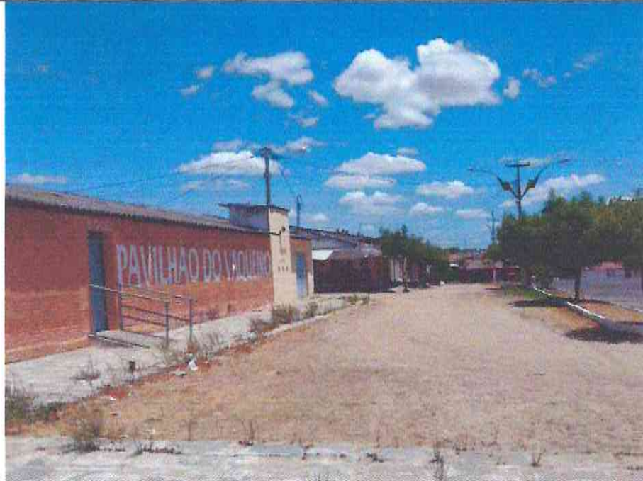
Início (Estaca E00) da Rua Luiz Nobre (Bairro: Henrique Hermógenes Girão) UTM 567697.60 /9435687.21