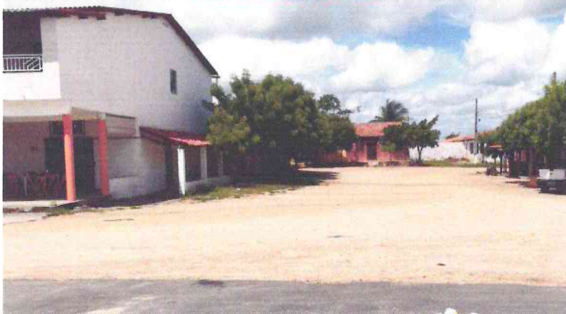
Final (Estaca E02 + 0,22m) da Travessa Conrado Machado (Bairro: Henrique Hermógenes Girão) UTM 567695.35/9435602.53