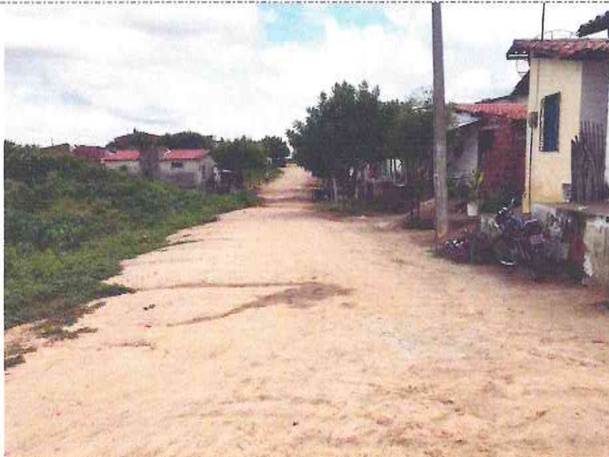
Final (Estaca E08 + 19,16m) da Rua Aloizio Furtado Girão (Bairro: Henrique Hermógenes Girão) UTM 568085.32/9435902.14