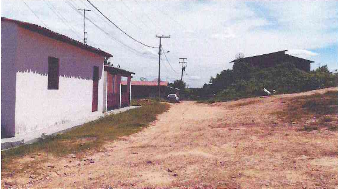
Início (Estaca E00) da Rua José Henrique (Bairro: Henrique Hermógenes Girão) UTM 567801.07/9435894.53