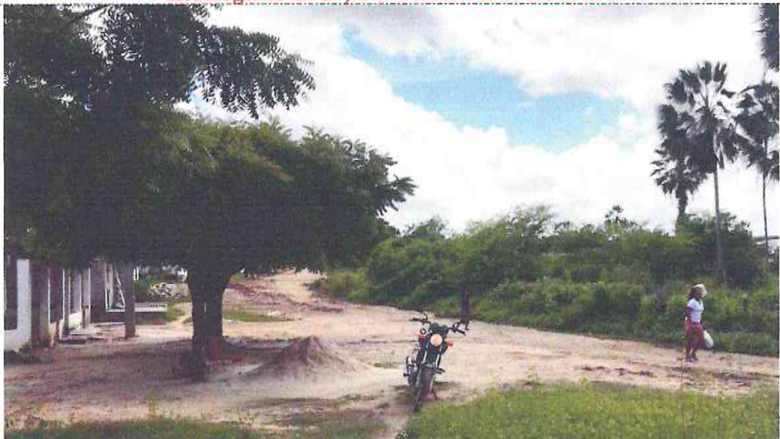
Final (Estaca E11 + 10,48m) do Trecho 01 da Rua José Evangelista Sobrinho (Bairro: Henrique Hermógenes Girão) UTM 567751.97/9435387.82