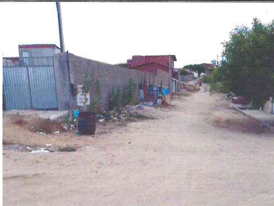
Início (Estaca E00) do Trecho da Rua Egídia Muniz Zacarias (Bairro: São Francisco) UTM 570064.00 /9436266.49