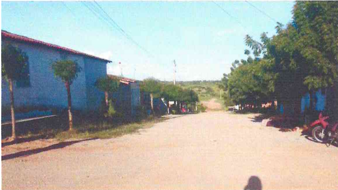
Início (Estaca E00) do Trecho da Rua Zeca Nobre (Bairro: Nova Morada) UTM 570657.60/9436682.39