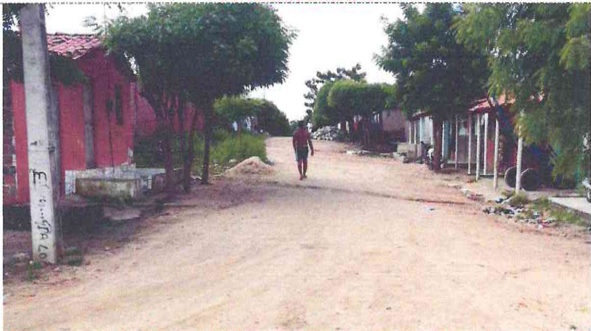
Final (Estaca E06 + 14,67m) da Rua Henrique Girão (Bairro: Henrique Hermógenes Girão) UTM 567602.38/9435457.18