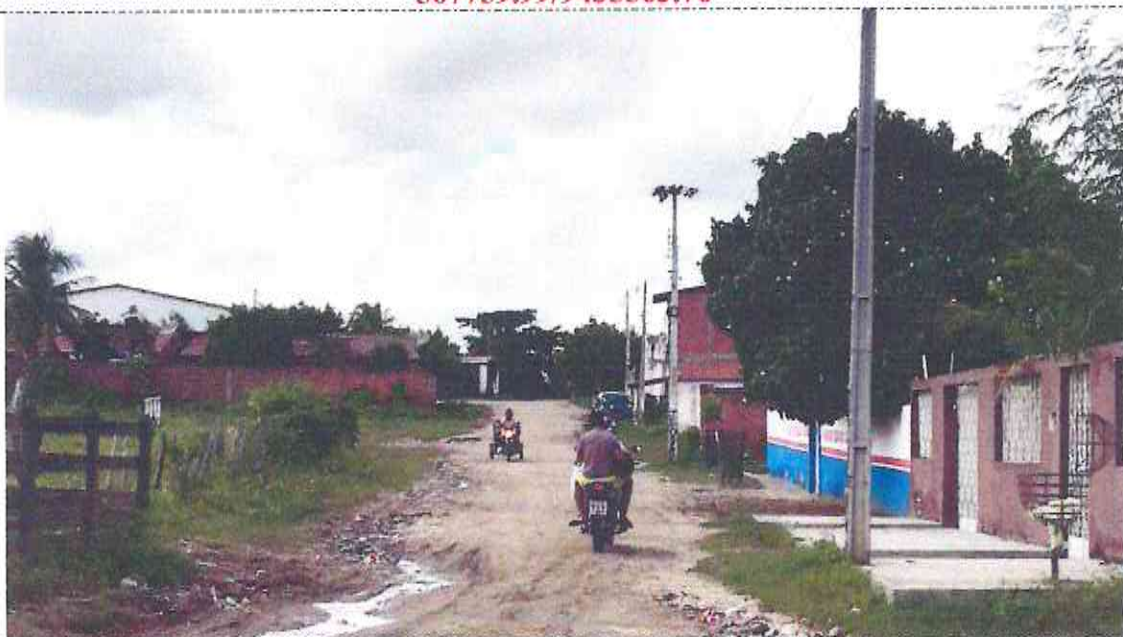
Final (Estaca E10 + 3,66m) da Rua Conrado Machado (Bairro: Henrique Hermógenes Girão) UTM 567557.44/9435542.72