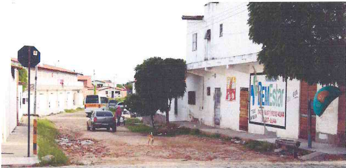
Início (Estaca E00) da Rua Antônio Bezerra (Bairro: 2 de Agosto) UTM 570243.20/9435636.50