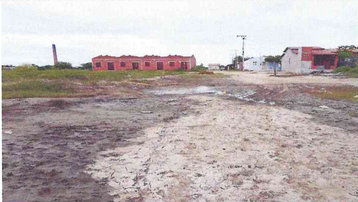
Final (Estaca E06 + 2,86m) do Trecho da Rua Luiz Adail Chagas (Bairro: Padre Assis Monteiro) UTM 569096.00/9435368