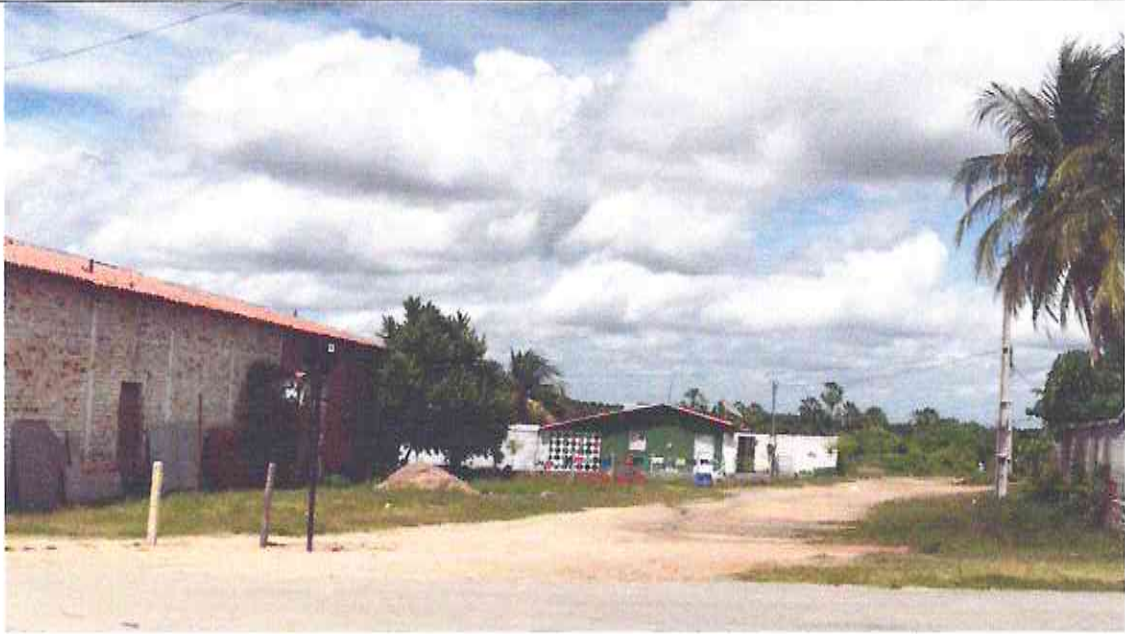
Início (Estaca E00) do Trecho 01 da Rua José Evangelista Sobrinho (Bairro: Henrique Hermógenes Girão) UTM 567769.30/9435614.31