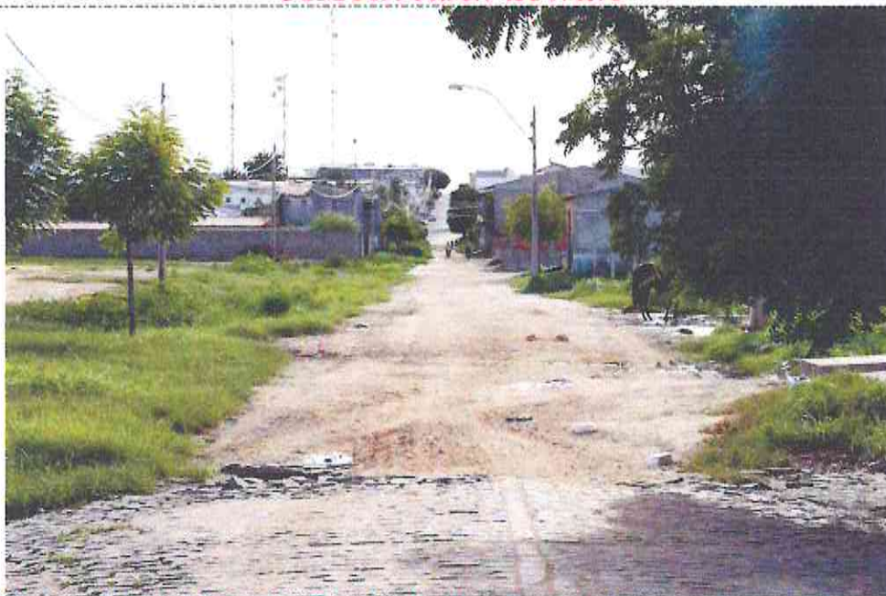
Final (Estaca E14 + 3,40m) do Trecho da Rua Benício Chagas (Bairro: 2 De Agosto) UTM 570241.93/9435440.80