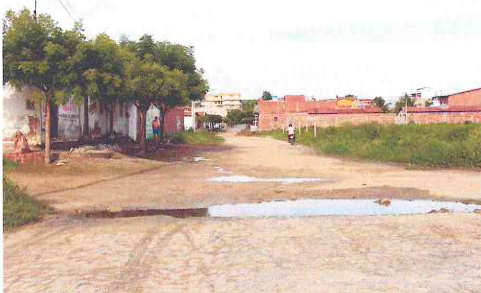
Início (Estaca E00) da Rua Joaquim Chagas Filho (Bairro: 2 De Agosto) UTM 570155.10/9435515.50