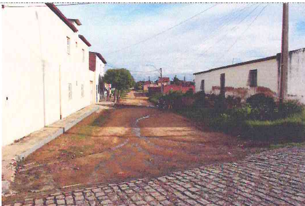
Final (Estaca E11 + 12,00m) da Rua Duque Rabelo (Bairro: 2 De Agosto) UTM 570160.21/9435574.01