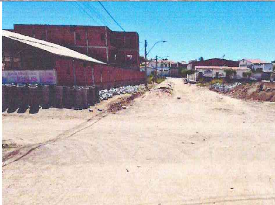
Início (Estaca E00) da Rua Duque Rabelo (Bairro: 2 De Agosto) UTM 570129.59/9435344.31