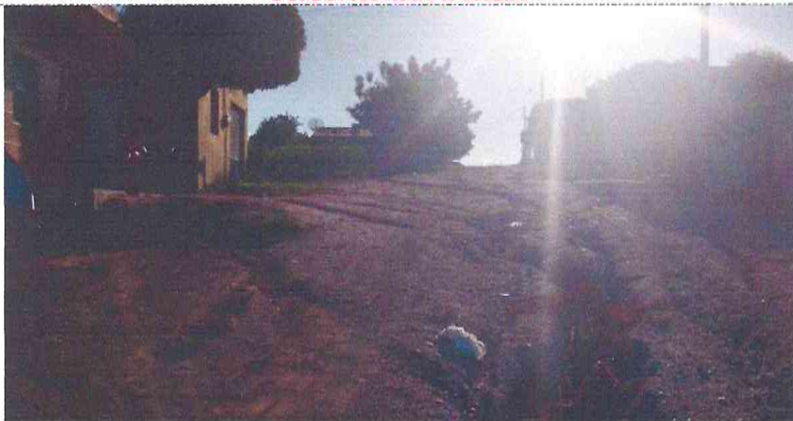
Final (Estaca E06 + 09,68m) do Trecho da Rua Zeca Nobre (Bairro: Nova Morada) UTM 570784.05/9436653.62