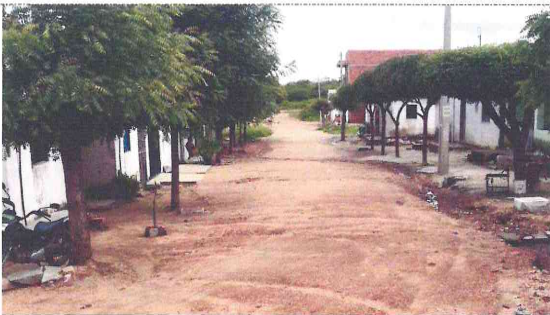
Final (Estaca E07 + 13,91m) da Rua Santa Luzia (Bairro: Henrique Hermógenes Girão) UTM 568083.88/9436036.32