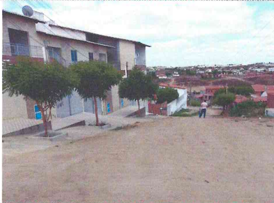
Final (Estaca E10 + 4,71m) do Trecho da Rua Egídia Muniz Zacarias (Bairro: São Francisco) UTM 570234.85/9436155.92