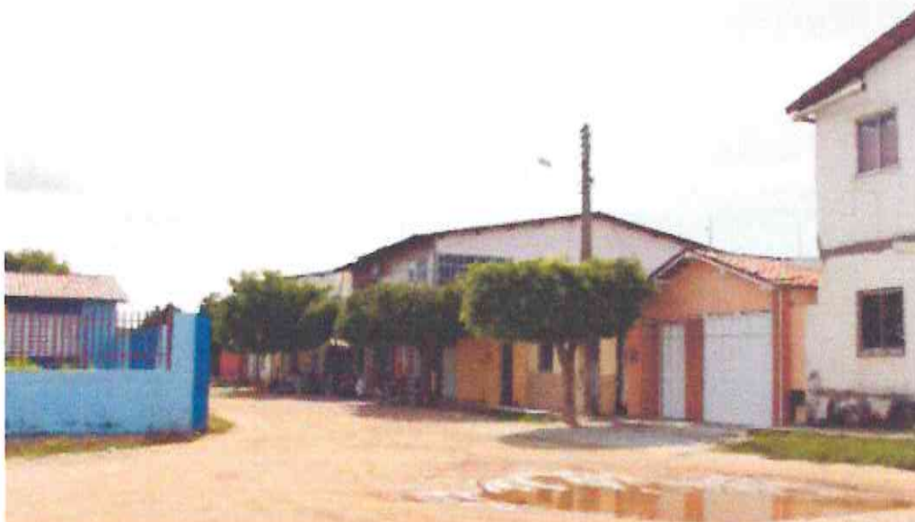
Início (Estaca E00) da Rua José Lourenço Filho (Bairro: Padre Assis Monteiro) UTM 569345.00 /9435213.00