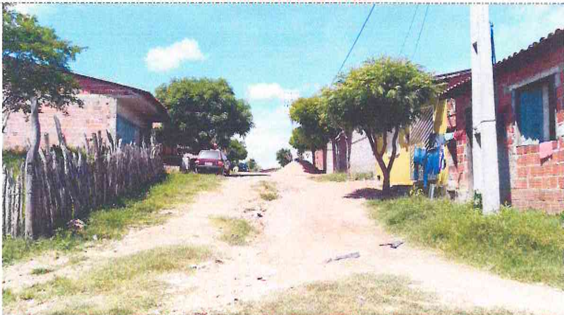
Final (Estaca E14 + 14,71m) da Rua José Henrique (Bairro: Henrique Hermógenes Girão) UTM 567667.49/9435911.93