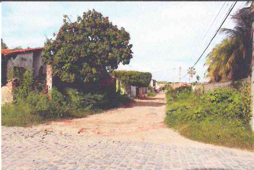
Início (Estaca E00) do Trecho da Rua Benício Chagas (Bairro: 2 De Agosto) UTM 569960.93/9435476.78