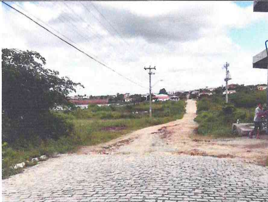
Início (Estaca E00) da Rua Cel. José Paulo Girão (Bairro: Henrique Hermógenes Girão) UTM 568298.21/9435781.77