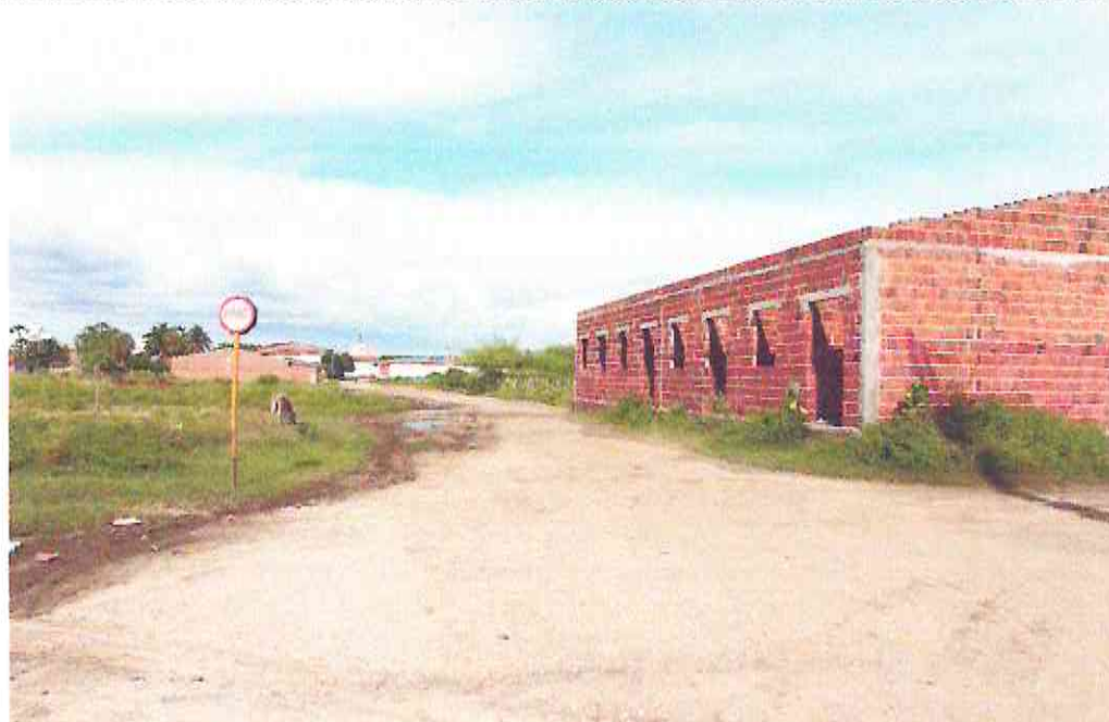
Final (Estaca E14) da Rua José Lourenço Filho (Bairro: Padre Assis Monteiro) UTM 569069.00 /9435255.00