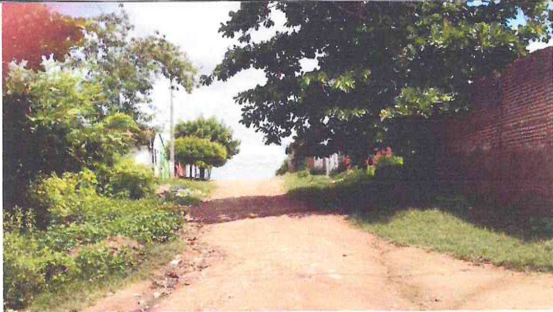
Início (Estaca E00) da Rua Conrado Machado (Bairro: Henrique Hermógenes Girão) UTM 567759.99/9435563.76