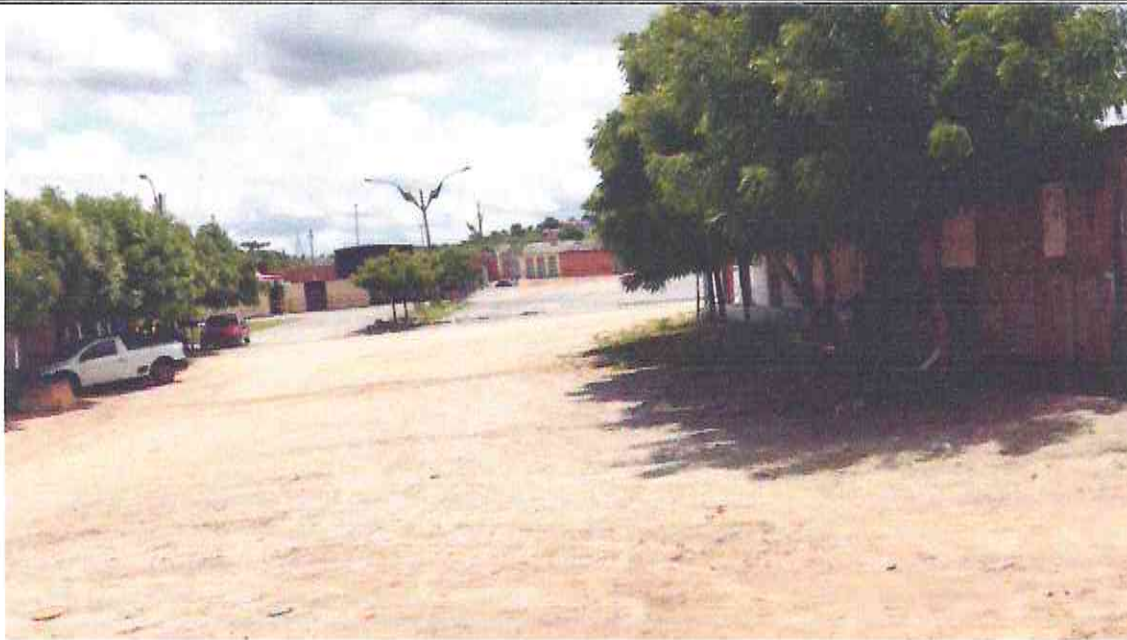
Início (Estaca E00) da Travessa Conrado Machado (Bairro: Henrique Hermógenes Girão) UTM 567695.18/9435562.30