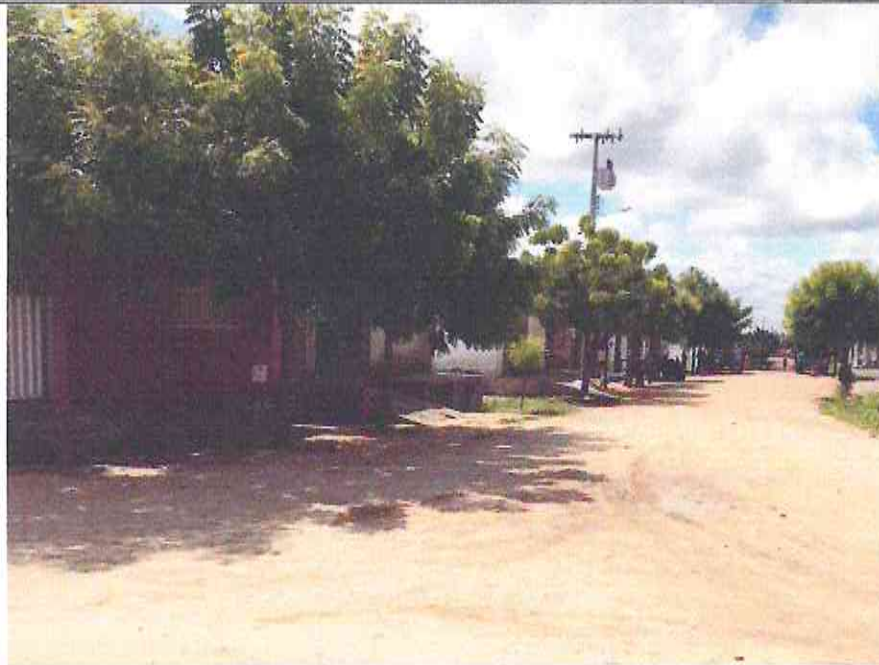
Início (Estaca E00) da Rua Aloizio Furtado Girão (Bairro: Henrique Hermógenes Girão) UTM 567908.07 /9435928.22