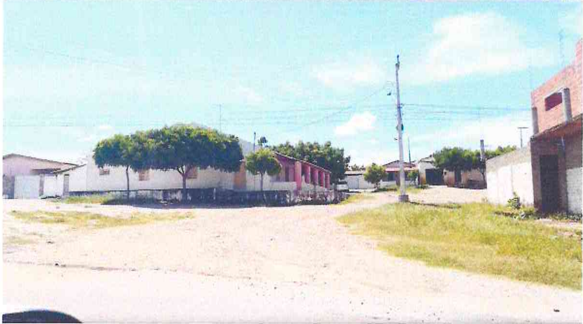
Início (Estaca E00) da Rua Gumercindo José Da Silva (Bairro: Henrique Hermógenes Girão) UTM 567850.30/9435815.72