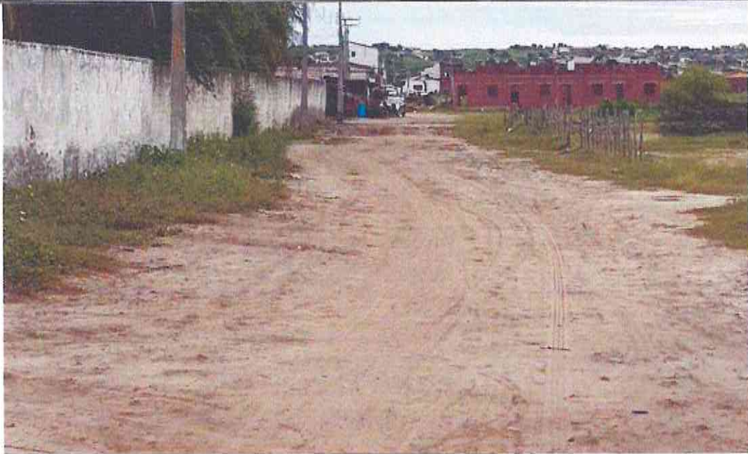
Início (Estaca E00) do Trecho da Rua Luiz Adail Chagas (Bairro: Padre Assis Monteiro) UTM 569064.00 /9435252.00