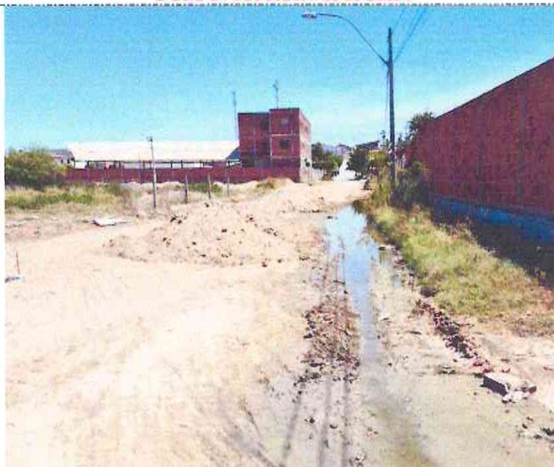
Final (Estaca E08 + 2,12m) da Rua Joaquim Chagas Filho (Bairro: 2 De Agosto) UTM 570248.52/9435503.28