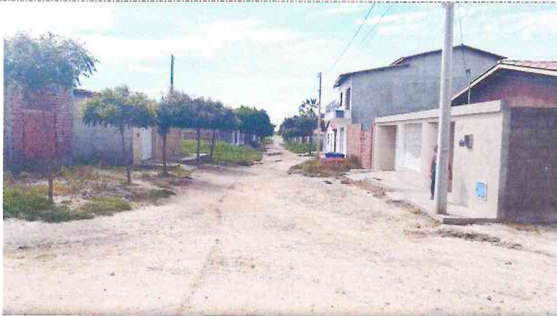
Final (Estaca E01 + 14,36m) da Rua Sem Denominação (Bairro: São Francisco) UTM 569765.49/9436046.30