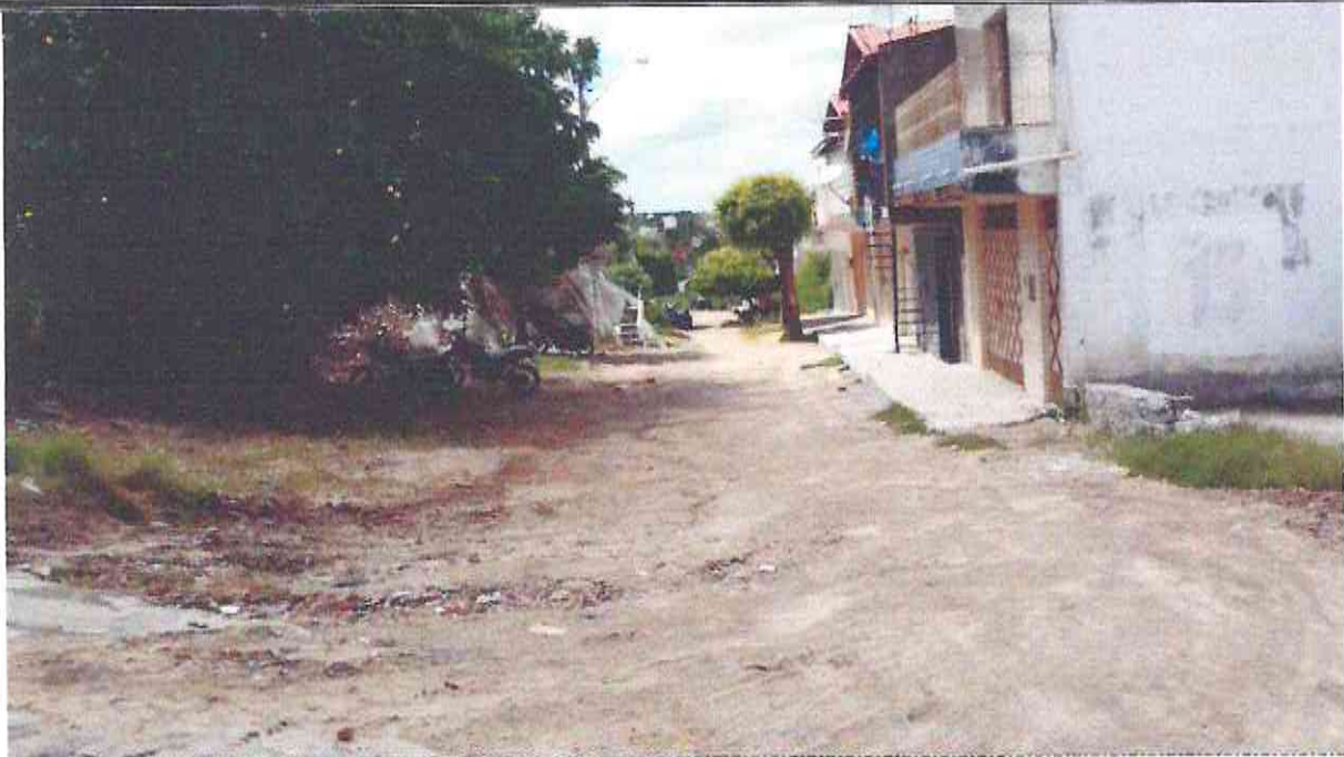
Início (Estaca E00) da Rua Zacarias Fernandes (Bairro: Centro) UTM 569728/9435452