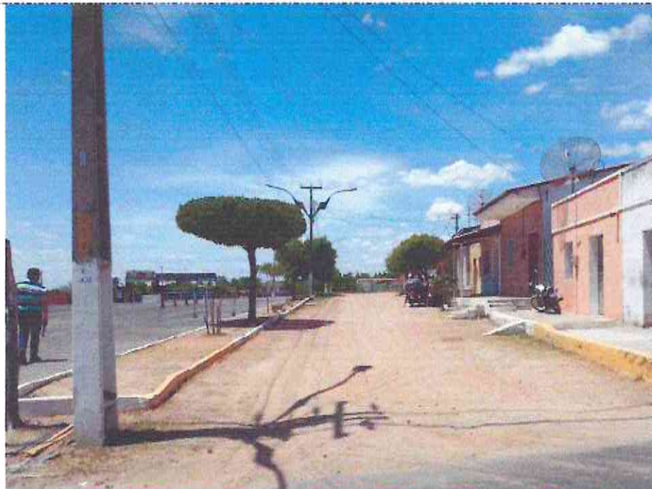
Final (Estaca E03 + 13,35m) da Rua Luiz Nobre (Bairro: Henrique Hermógenes Girão) UTM 567770.41/9435678.34