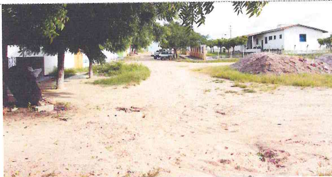
Final (Estaca E09) do Trecho da Rua Raimundo Nonato Tavares (Bairro: Irapuan Nobre)