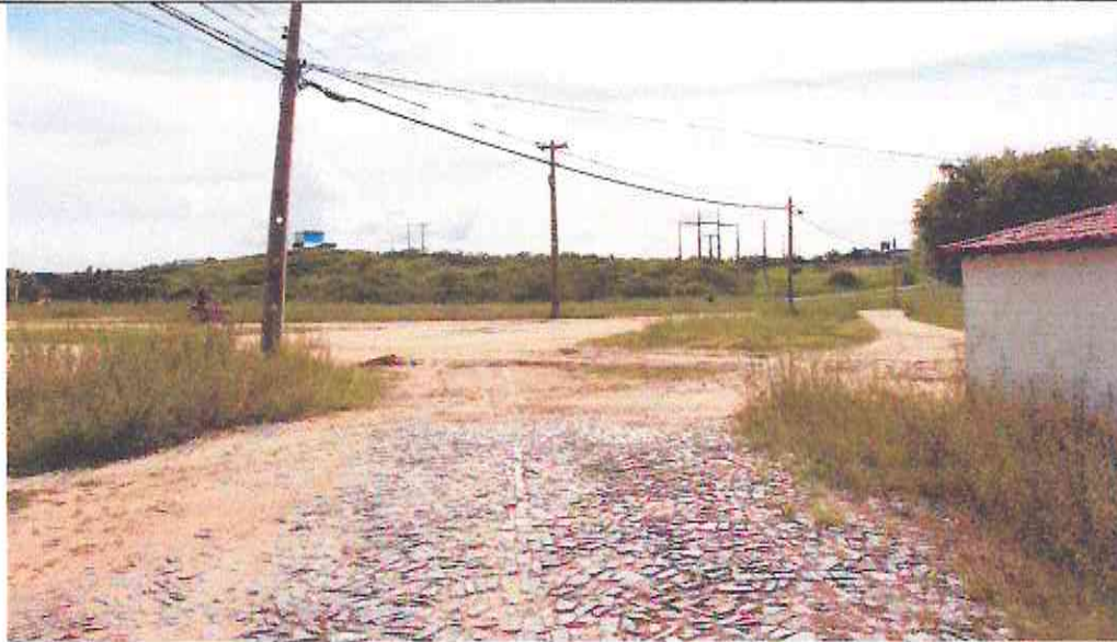
Início (Estaca E00) do Trecho da Rua Domingos Lúcio Da Silva (Bairro: Irapuan Nobre)