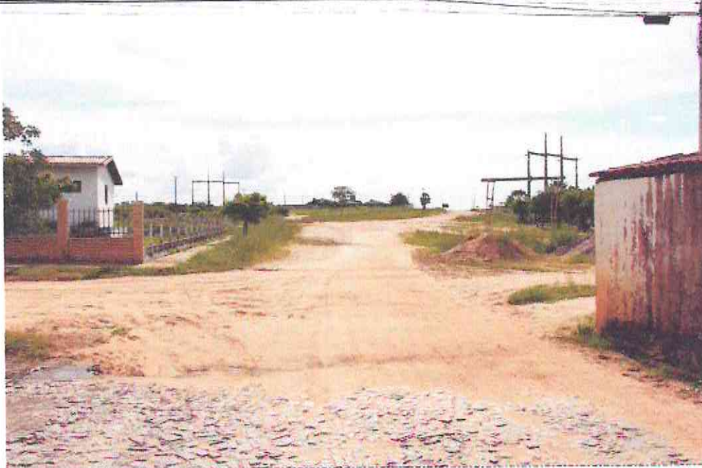
Início (Estaca E00) do Trecho da Rua João Garcia (Bairro: Irapuan Nobre)