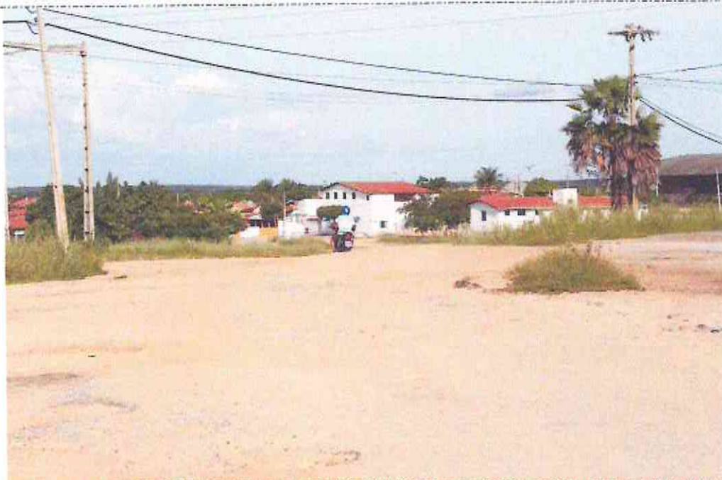
Final (Estaca E12 +14,00m) do Trecho da Rua João Garcia (Bairro: Irapuan Nobre)