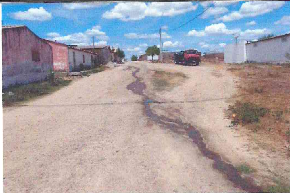
Início (Estaca E00) do Trecho da Rua José Carneiro Filho