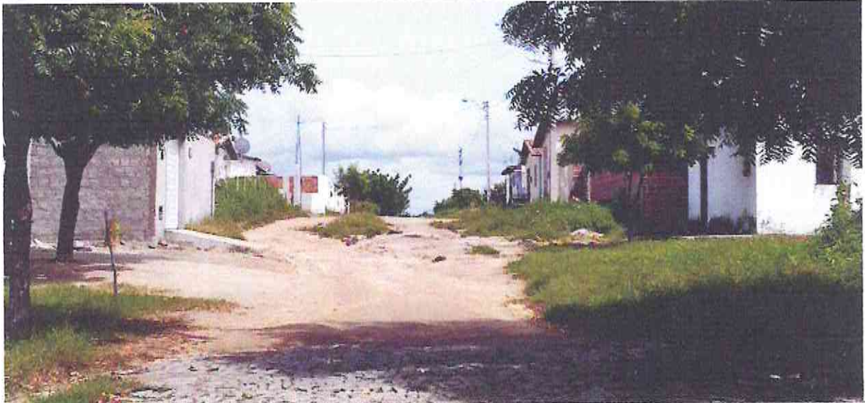
Início (Estaca E00) do Trecho da Rua Guilherme Cavalcante