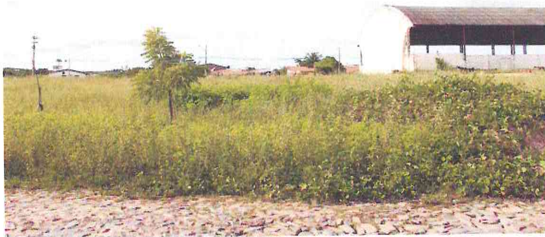
Início (Estaca E00) do Trecho da Rua Raimundo Nonato Tavares (Bairro: Irapuan Nobre)