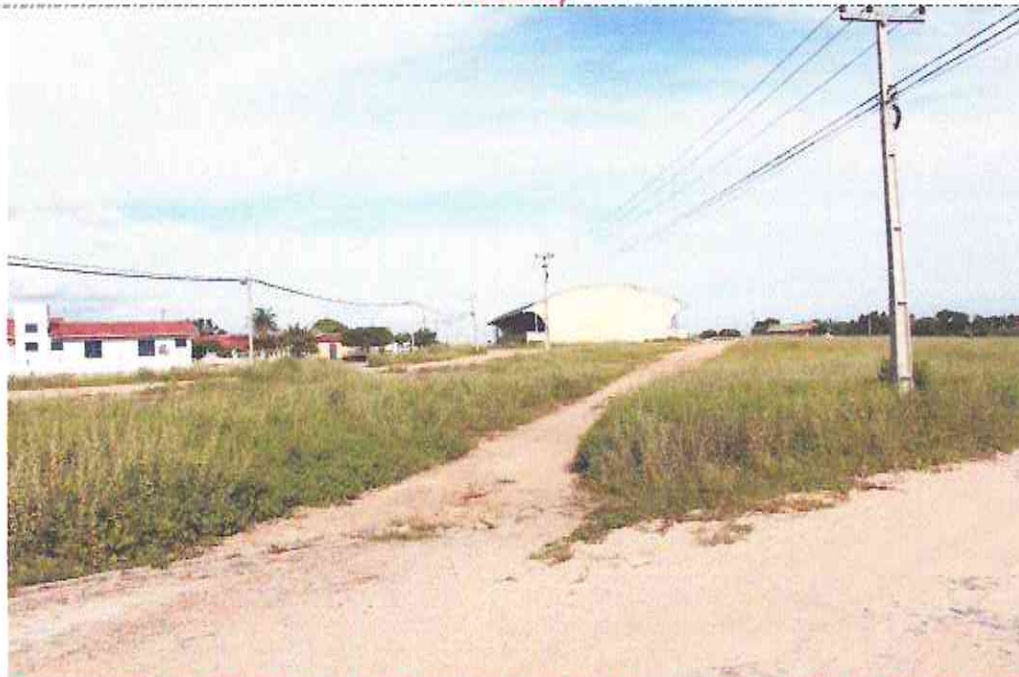
Final (Estaca E04 + 19,00m) do Trecho da Rua Domingos Lúcio Da Silva (Bairro: Irapuan Nobre)