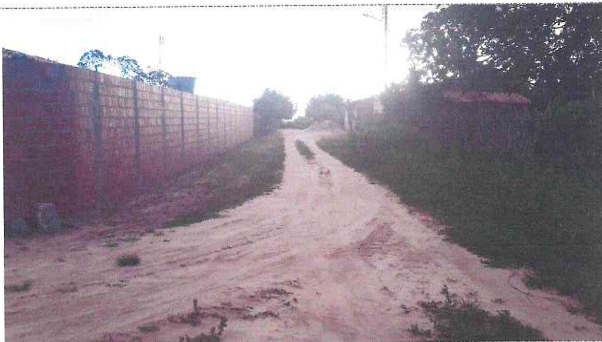
Final (Estaca E18 + 16,00m) do Trecho da Rua Antônio Francisco Machado