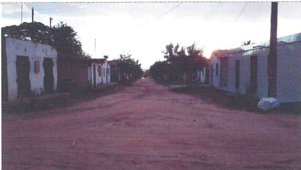
Final (Estaca E24 + 7,40m) do Trecho da Rua Loíde Holanda

Osmanir C. de Mendonça Jr Engº Civil / CREA-CE:49409-D RN:061095914-0