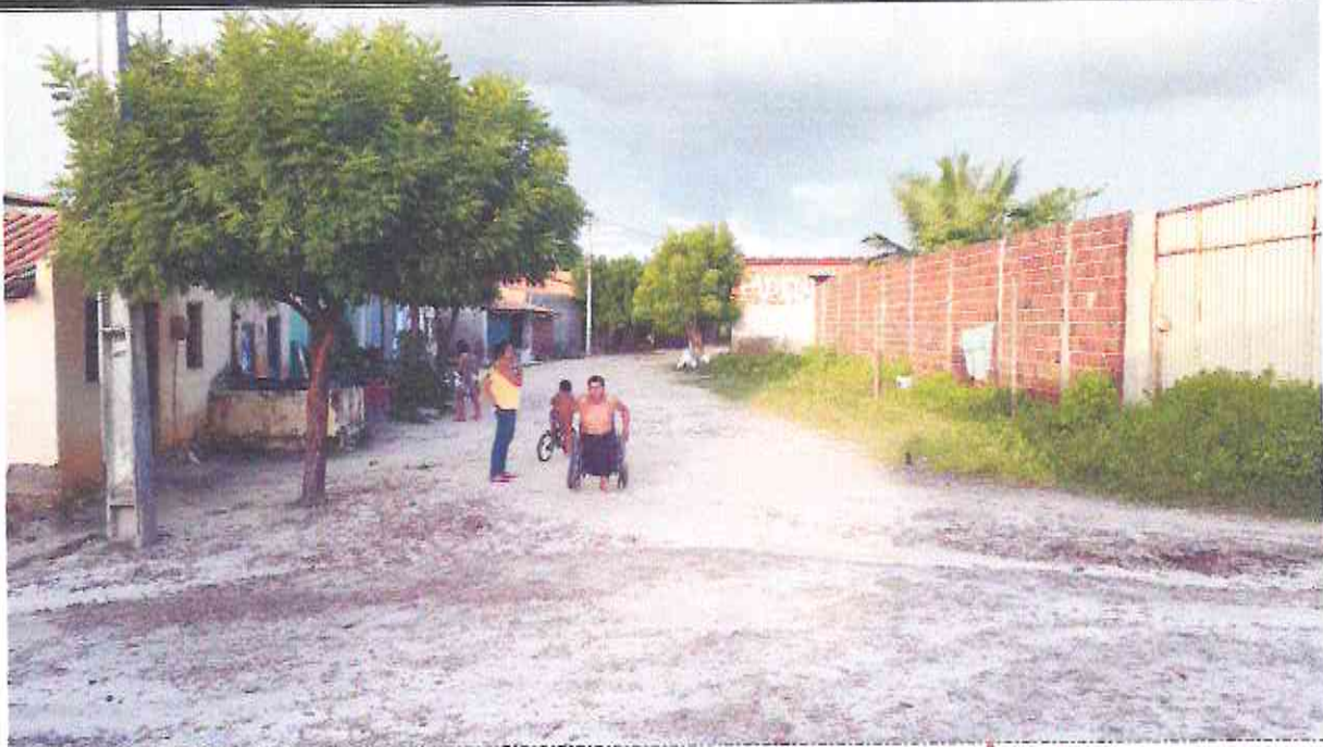
Início (Estaca E00) da Travessa Raimundo Ângelo