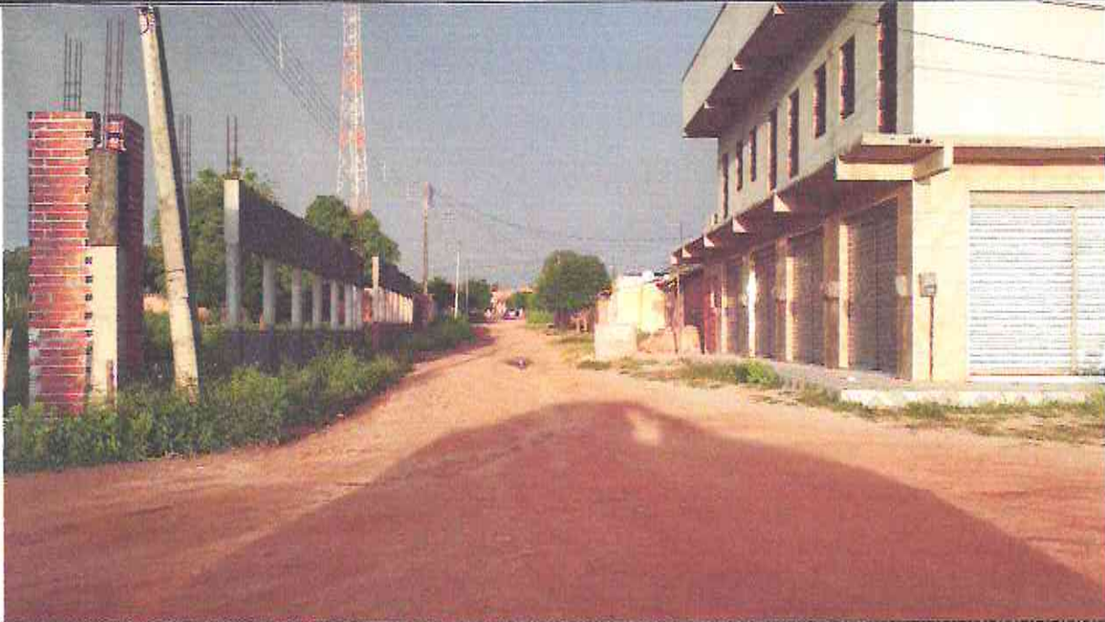
Início (Estaca E00) do Trecho da Rua Loíde Holanda