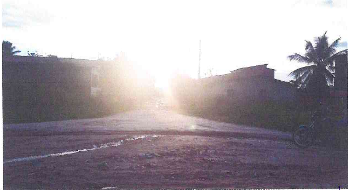
Final (Estaca E05 + 10,00m) da Travessa Raimundo Ângelo