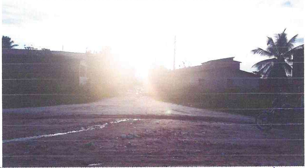
Final (Estaca E28 + 17,00m) do Trecho da Rua Luis Silva

Osmanir G. de Mendonça Jr Engº Civil / CREA-CE:49409-D 1 RSC01385914-0