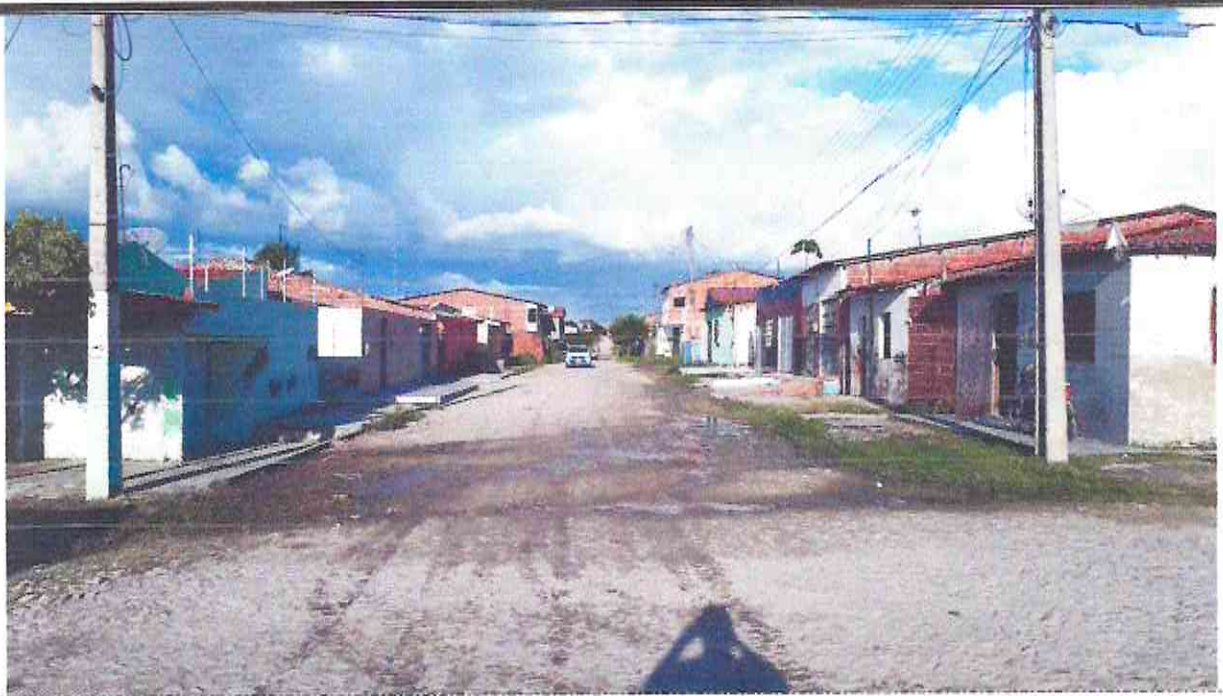
Início (Estaca E00) do Trecho da Rua Luis Silva