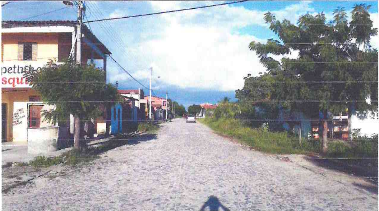
Início (Estaca E00) do Trecho Da Rua Raimundo José