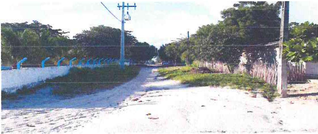
Início (Estaca E00) da Rua Professora Aurélia