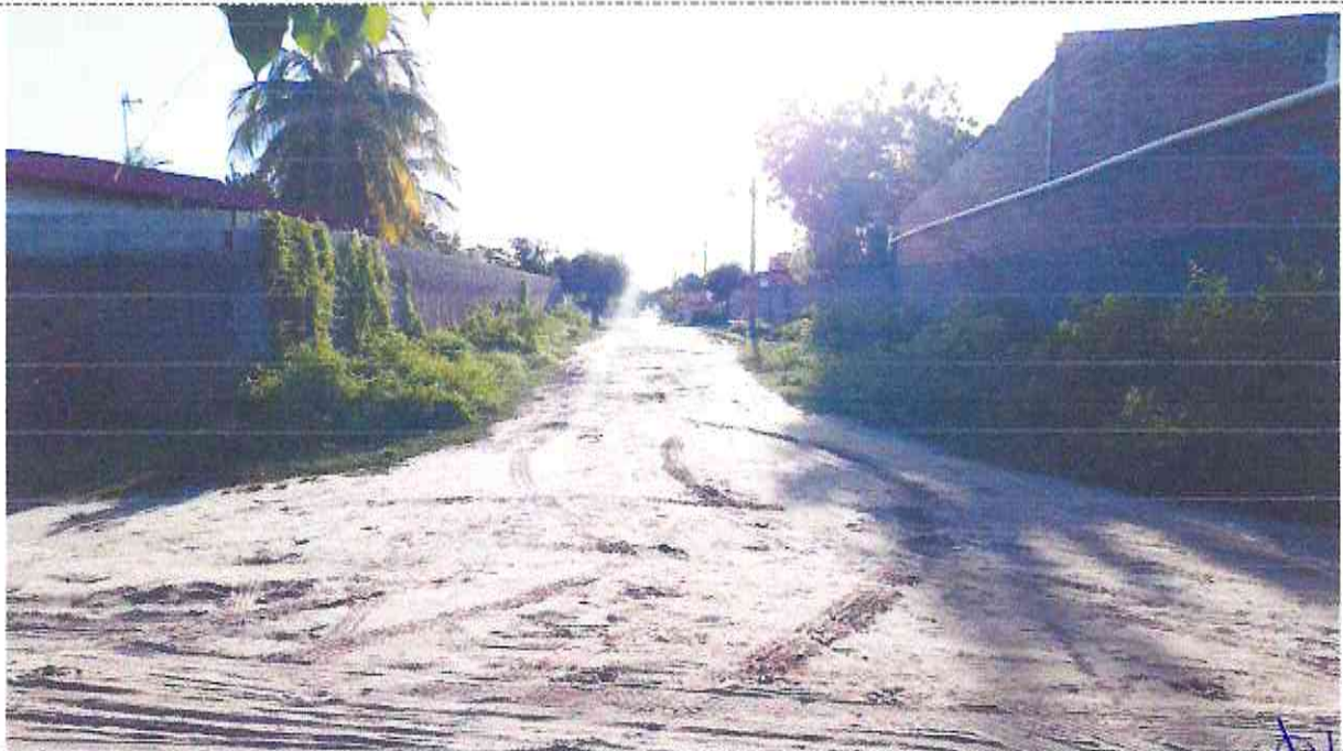
Final (Estaca E27 + 5,00m) do Trecho Da Rua Raimundo José

Osmanir C. de Mendonça JB Engº Civil / CREA-CE:49409-D RN.061095914-0