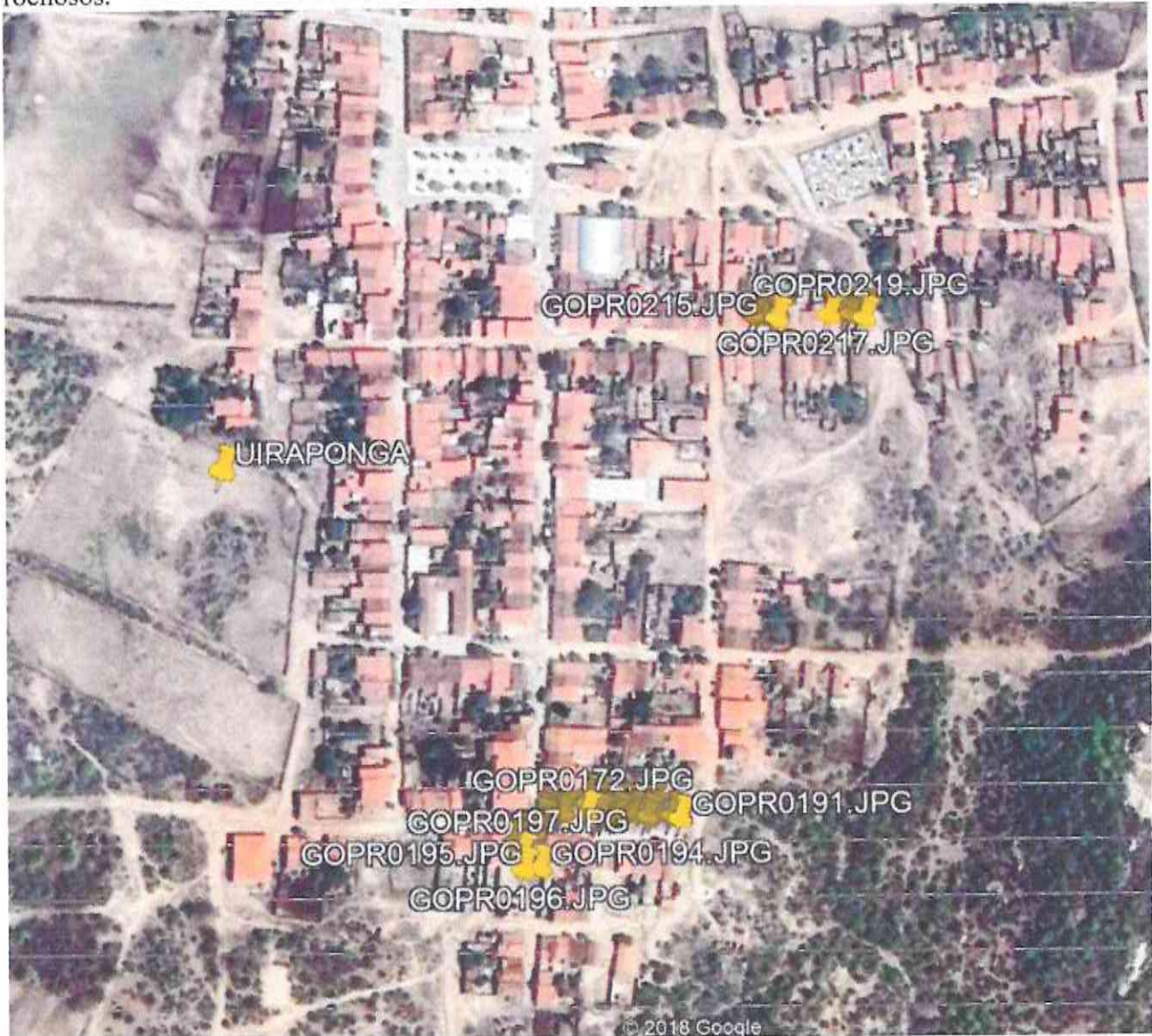
Figura 1 - localização dos aglomerados no distrito de Uiraponga

Levantamento georreferenciado, referente a localização das retiradas dos aglomerados rochosos.