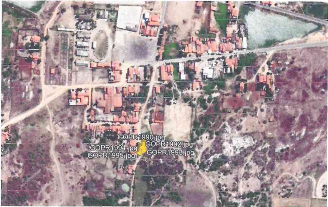
Figura 3 - Rochas no parque da exposição