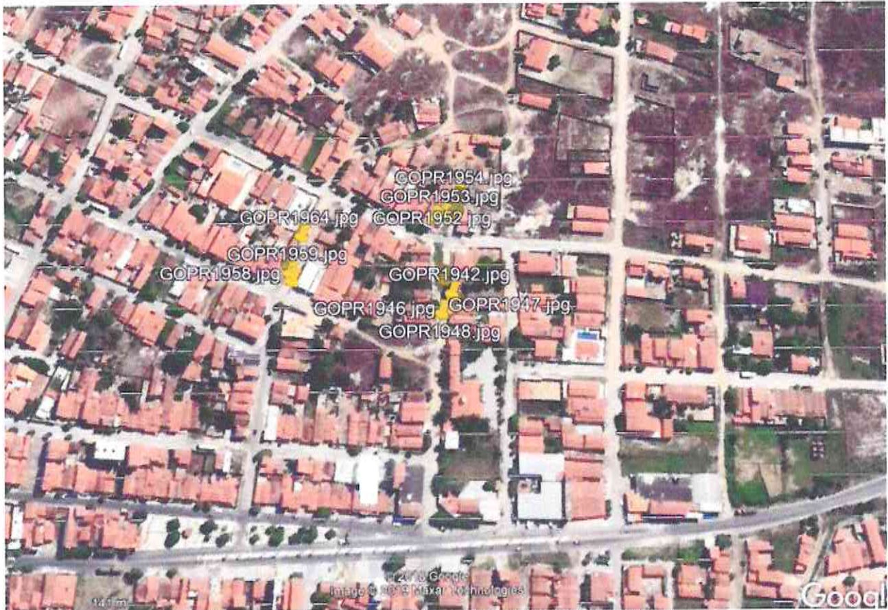
Figura 2 - Rochas na rua Henrique Marinheiro e Antonio Bezerra