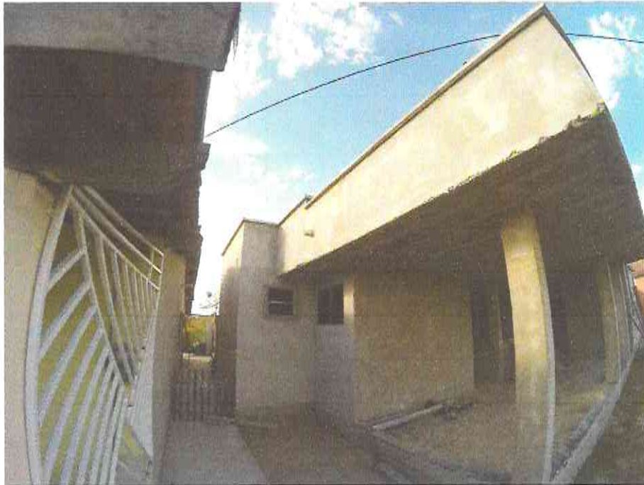
Figura 8