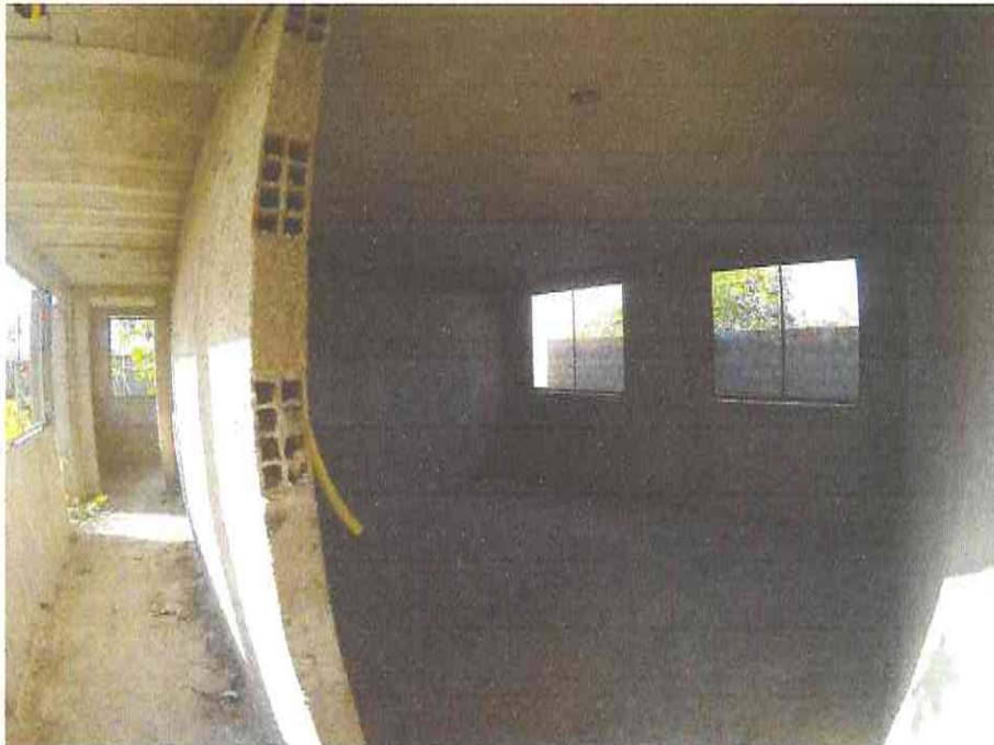
Figura 5 - Acervo do autor