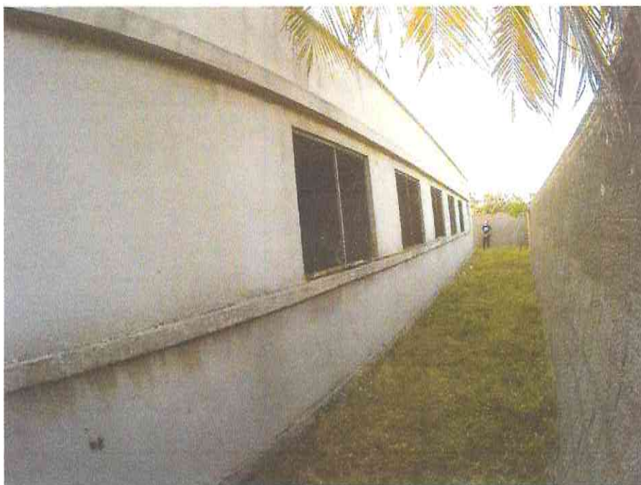
Figura 11 - Acervo do autor

MORADA NOVA – CE, 18 DE FEVEREIRO DE 2019.