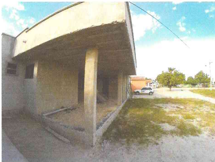
Figura 9