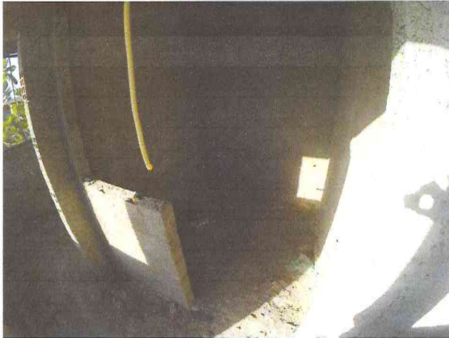
Figura 6

Comissão de Licitação N.º 125 Morada Nova - Ce