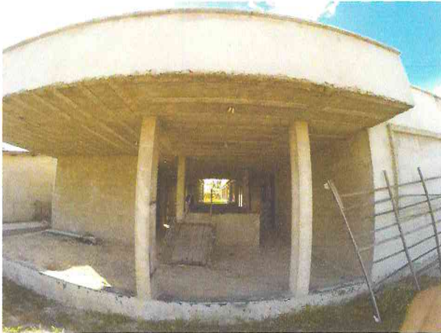
Figura 2 - Acervo do autor

Comissão de Licitação FL. 123 Morada Nova - CE