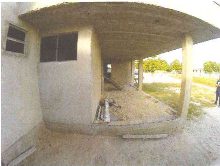
Figura 10