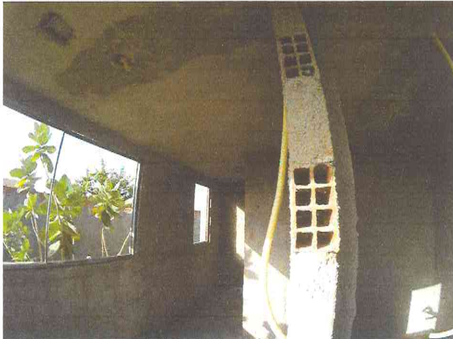
Figura 7