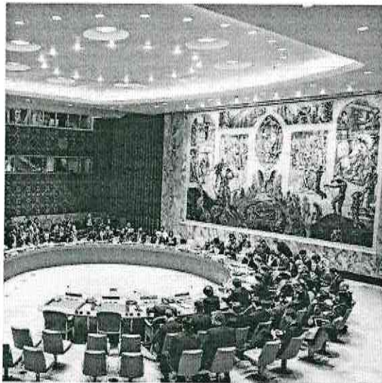
Conselho de Segurança da ONU discutiu, ontem, a crise venezuelana

A última eleição presidencial, realizada em maio, "carece de legitimidade democrática", avaliaram Reino Unido, Alemanha, França, Bélgica e Polónia em um comunicado, pedindo "o retorno à democracia por meio de eleições